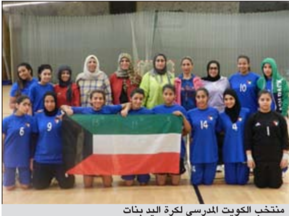
منتخب الكويت المدرسي لكرة اليد بنات