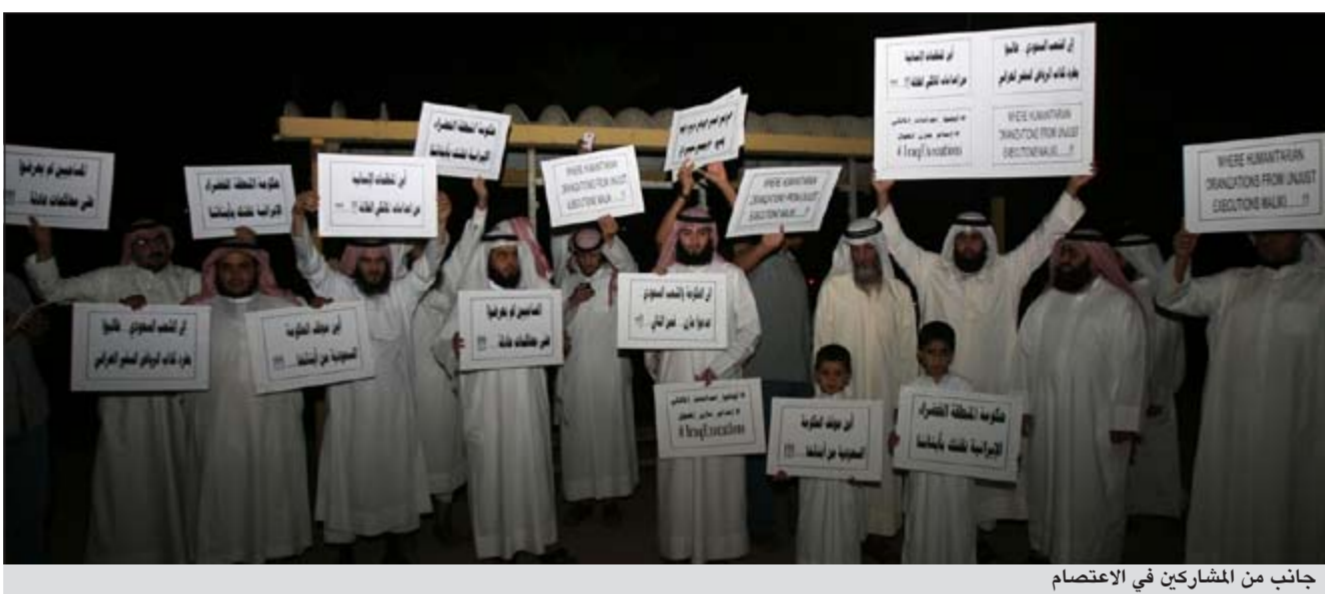
جانب من المشاركين في الاعتصام

احتشد عشرات المواطنين مساء اول من امس امام مقر السفارة العراقية بالبلاد احتجاجاً على ما سموه الإعدامات التعسفية الطائفية التي قامت بها حكومة رئيس الوزراء العراقي نوري المالكي ضد عدد من السنة. وحمل المتظاهرون لافتات تستنكر الإجراءات الطائفية التي قامت بها حكومة المالكي في حق المعتقلين. وكانت حكومة المالكي قد لاقت استنكاراً عربياً ودولياً كبيراً جراء الإعدامات التي نفذتها في حق من أسمتهم بالإرهابيين.