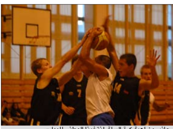
جانب من لعبة كرة السلة لمنتخبنا الوطني للمدارس