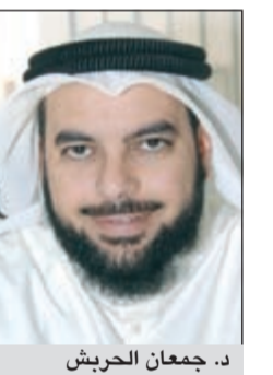
د. جمعان الحربش

أكد النائب د. جمعان الحربش أن الحلف الخليجي المصري أصبح ضرورة استراتيجية في الوقت الحالي في مواجهة المشروع التوسعي الإيراني في المنطقة، محذراً من الاستماع الى مستشاري الأجهزة الأمنية القمعية للنظم العربية في هذه المسألة. وقال الحربش من حسابه على تويتر: الحلف الخليجي المصري التركي ضرورة استراتيجية للوقوف امام المشروع التوسعي الإيراني. وأضاف: شريطة ألا تستمع بعض الحكومات الخليجية لمستشاري الأجهزة الأمنية للنظم القمعية العربية الساقطة الذين أدت مشورتهم لهدم انظمتهم حين حرصوها على الشعوب وإذا كان الغراب دليل قوم يمر بهم على جيف الكلاب.