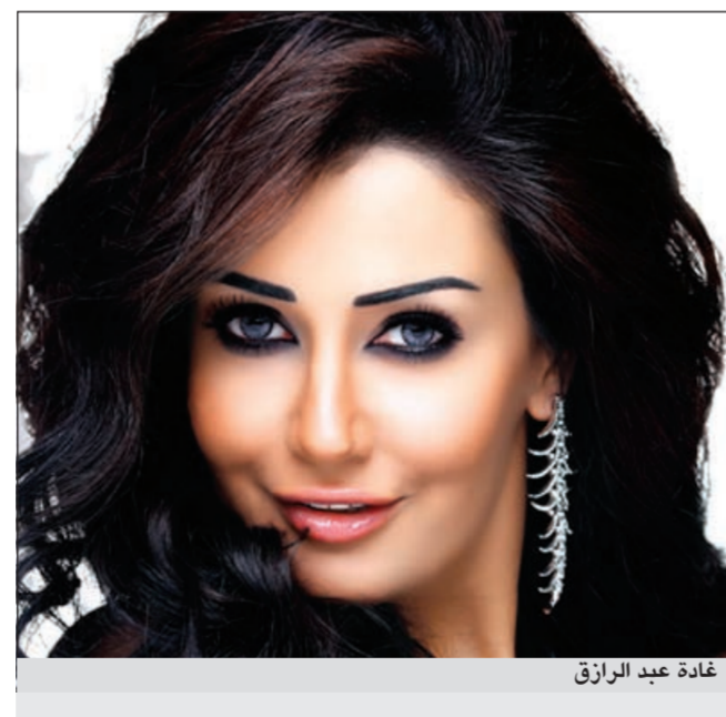
غادة عبد الرزاق

وتدور أحداث الفيلم طوال ساعتين العرض داخل غرفة واحدة، وغادة هي البطلة الوحيدة مع نجمين يجري الاتفاق معهما حالياً، بعد اعتذار خالد صالح وعمرو سعد لاختلافهما على الأجر. وعن «غرسونيرة» يقول فوزي: «إنها الشقة التي يختلي بها الشباب بعشيقاتهم، هو لفظ قديم وحاليا تسمى بالخن» نأفيا احتواء الفيلم على أي مشاهد مثيرة، مؤكداً أنه فيلم اجتماعي، ولكنه لا يمانع في تقديم هذه المشاهد إذا كانت ضرورية وتخدم قصة العمل.