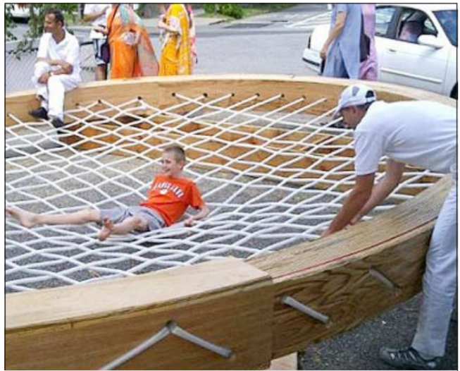
مضرب التنس الأكبر في العالم

نحج في تحطيم حوالي 400 رقم قياسي عالمي «اكتشفت أن التامل يعطي ثماره. ففي وسعنا تحقيق المستحيل إذا رجعنا إلى قرارة أنفسنا». وقد حطم هذا النيويوركي 151 رقما قياسيا، وفقا لمجموعة غينيس للأرقام القياسية، ويأمل أن يضيف هذا المضرب إلى قائمة إنجازاته، غير أنه لم يجد بعد مكانا يعرضه فيه.