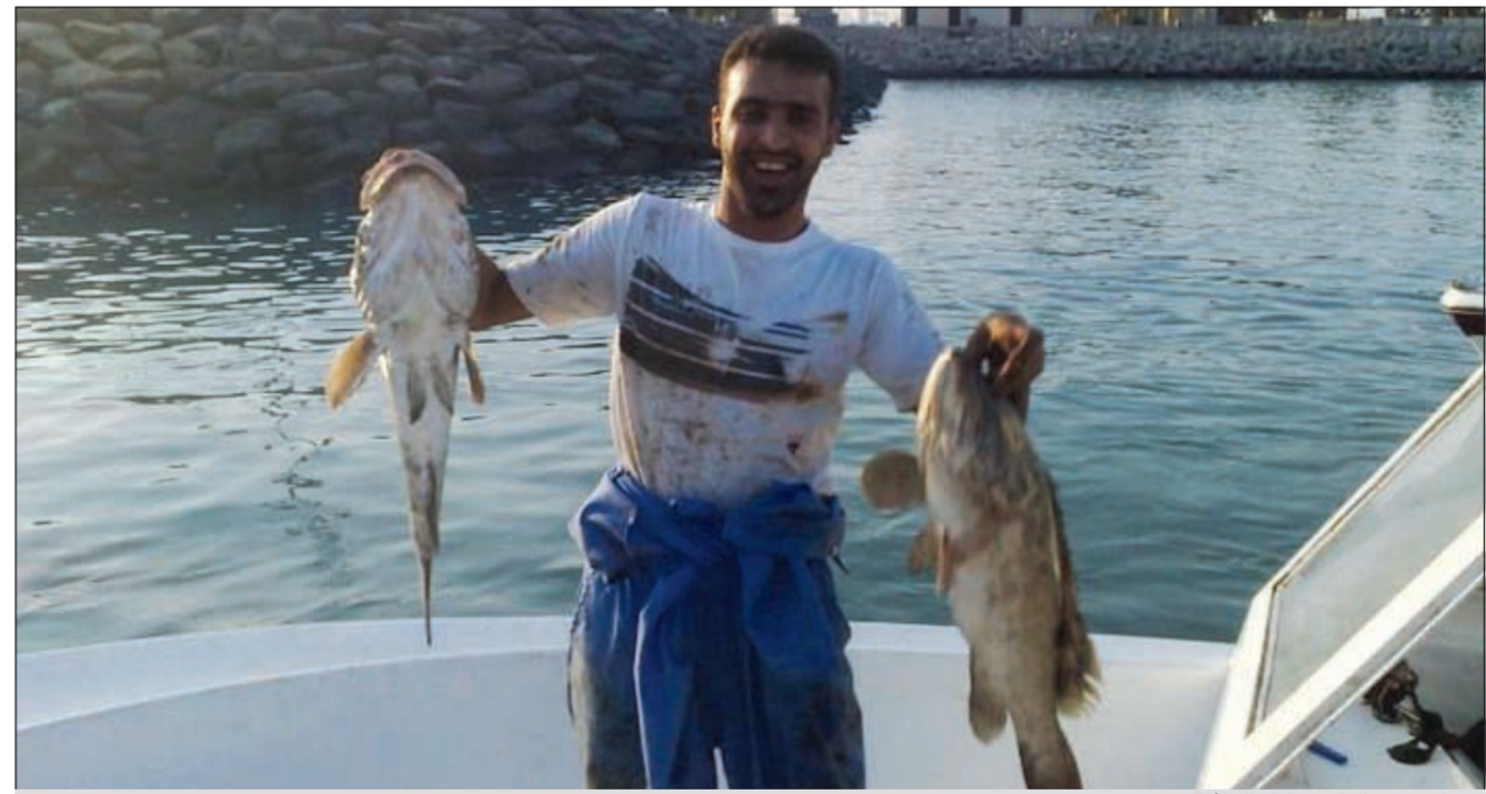
هوامير وبواليل يعطيك العافية

خير البحر لا ينقطع فقد خاضه الآباء والأجداد وجلبوا منه كل يوم أسماكاً عديدة إلى يومنا هذا فهل تطلعتنا على أسماك التي تجلبها من بحر الآباء والأجداد؟ ● نعم كلامك صحيح في بداية