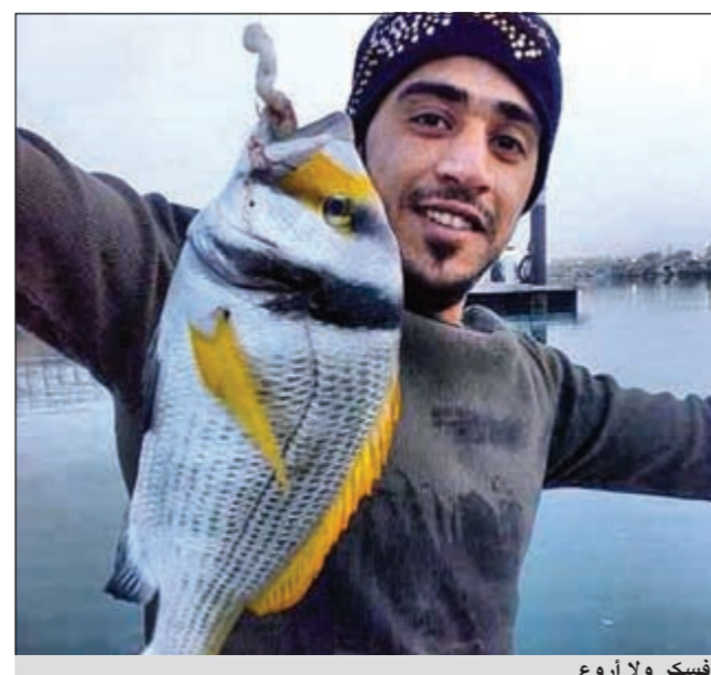
فسكر ولا اروع