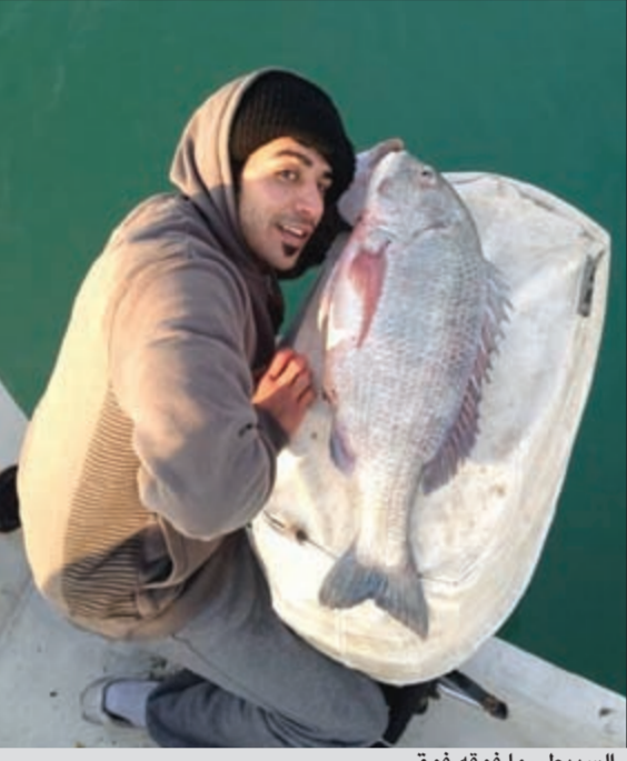
السببتي ما فوقه فوق