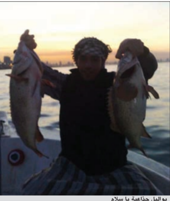
بواليل جذاعة يا سلام