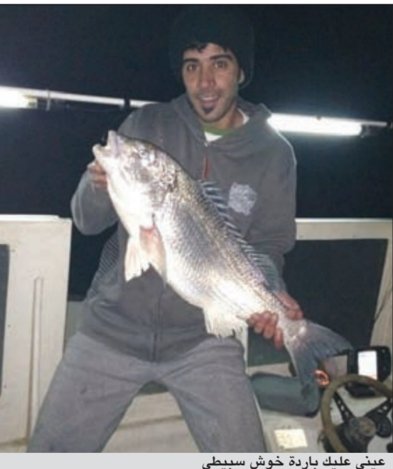
عيني عليك باردة خوش سببتي