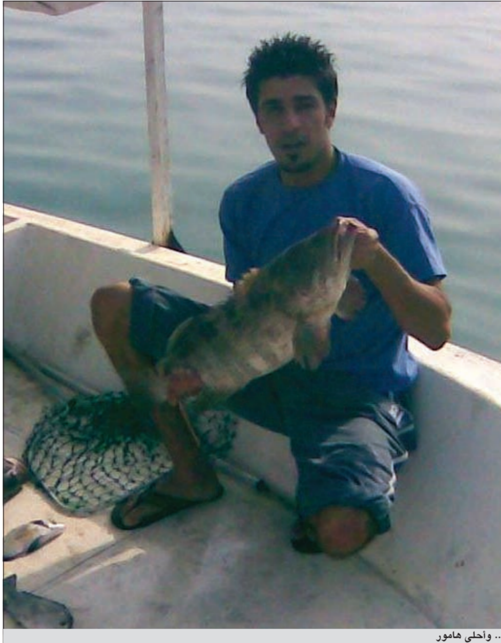
.. وأحلى هامور