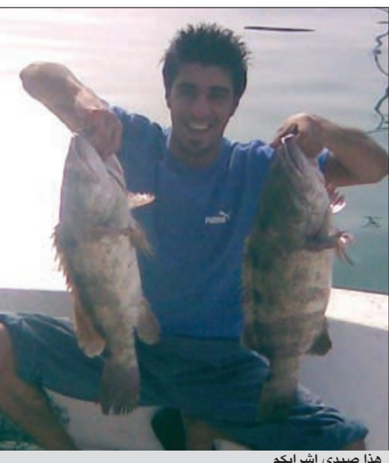
هذا صيدي اشرايكم