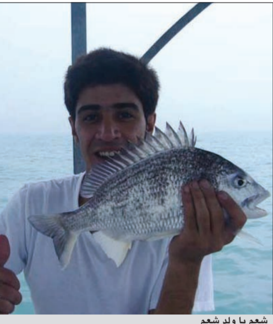
شع يا ولد شع