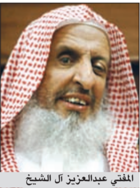
المفتي عبدالعزيز آل الشيخ

وقال الناطق الإعلامي لشرطة المنطقة الشرقية المقدم زياد الرقيطي، في بيان له أمس، «عند الساعة التاسعة والنصف من مساء الإثنين تعرض مواطنان في العقد الرابع من العمر لإطلاق نار على مركبتهم أثناء توقفهما بشوارع بمحافظة القطيف، من قبل شخصين مجهولين يستقلان دراجة نارية نتجت عنه إصابة أحدهما». وأضاف الرقيطي أنه تم نقل المصاب إلى المستشفى كما باشرت جهات التحقيق والبحث والتحري بشرطة محافظة القطيف والتحقيقات اللازمة في الواقعة.