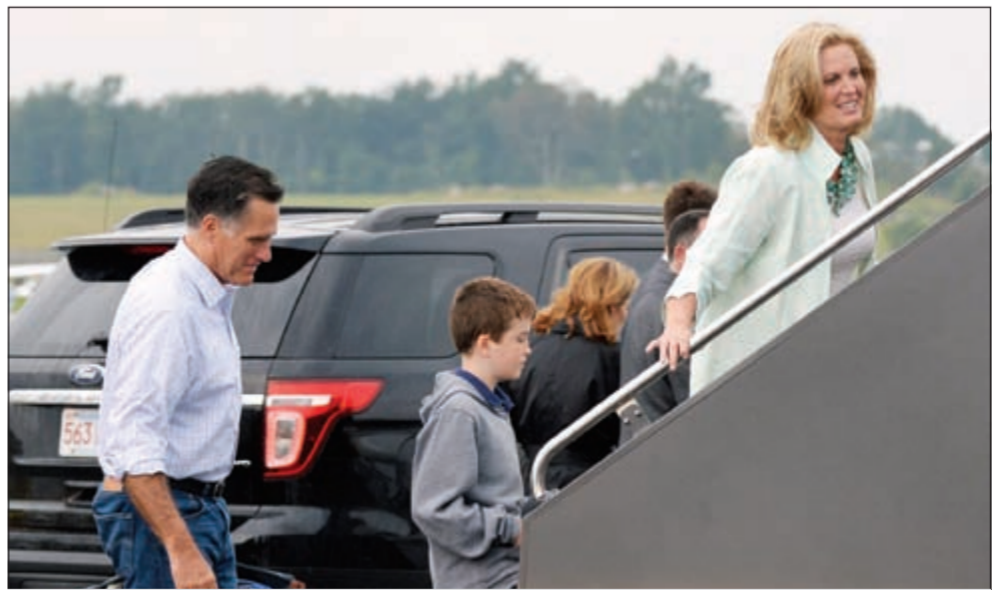
المرشح ميت رومني لدى استقباله الطائرة مع عائلته متوجها إلى مقر مؤتمر الحزب الجمهوري في تامبا أمس

على عجلة من أمره. وإذا كان المرشح المتزوج منذ 43 عاماً والأب لخمسة أولاد منضبطاً ولبقاً، إلا أنه في الوقت نفسه بارد وخطاب الناخبين وكأنه يلقيهم درساً، وهذا ما لا يساهم في تقربيه إلى قلوبهم وفوزه باصواتهم في انتخابات رئاسية كان يمكنه كسبها بسهولة بسبب ضعف الاقتصاد الأميركي الذي يهيم على الحملة.