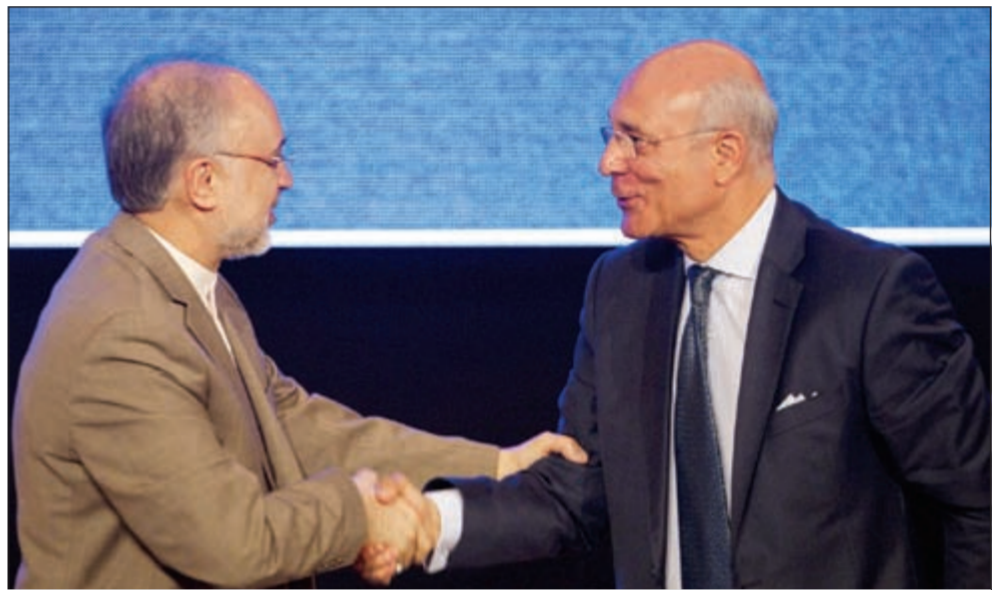
نائب وزير الخارجية المصري رمزي عز الدين يتسلم رئاسة مؤتمر «عدم الانحياز» لوزير الخارجية الإيراني علي صالحى

ولسنا ملزمين بتبنيها»، مؤكداً ان البرنامج النووي الإيراني «سلمي» ويجري بإشراف الوكالة الدولية للطاقة الذرية.