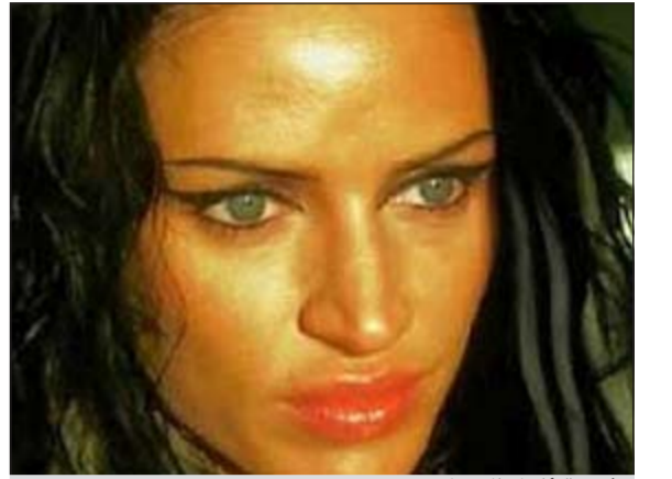
شبيهة أنجلينا جولي

وكالات: ادعى سائق سيارة اجرة روماني ان هناك سيدة تشبه الممثلة أنجلينا جولي قد قامت بطعنه بالسكين بعد ان رفض تلبية تحرشها به جسديا للمرة الثالثة على التوالي.