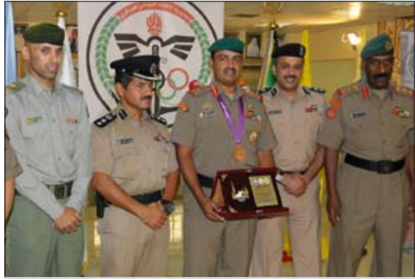
فهد الديحاني إلى جانب مسؤولي الاتحادات العسكرية الرياضية

الرياضية، وفي الختام قام ممثلو اللجنة الثلاثية للاتحادات العسكرية الرياضية بتكريم البطل الديحاني وأخذ الصور التذكارية لهذه المناسبة.