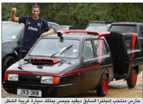
حارس منتخب إنجلترا السابق ديفيد جيمس يمتلك سيارة غريبة الشكل

العديد من النجوم الذي يمتلكون سيارات غريبة الشكل.