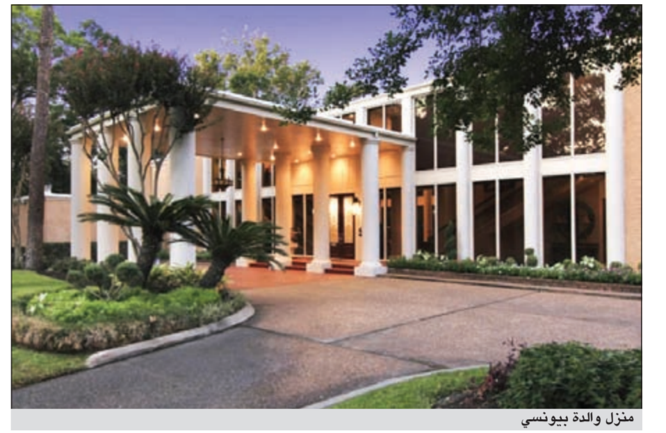
منزل والدة بيونسي

باريس - أ.ش.أ: يبذل مسؤولون عن برنامج «أميركان أيدول» لاكتشاف المواهب جهودا حثيثة لإقناع المغنية الأميركية الشهيرة كيت بيرلي للمشاركة في لجنة تحكيم البرنامج الذي يحظى بمعدلات مشاهدة عالية داخل الولايات المتحدة وخارجها. ونكرت مجلة «كلوزير» الفرنسية أن أميركان أيدول الذي تديره قناة «فوكس» رصدوا 20 مليون دولار لإغراء كيت بيرلي بالمشاركة في لجنة التحكيم. وأكدت اللجنة أن كيت بيرلي لاتزال حتى الآن مترددة في قبول هذا العرض المغربي بسبب إشغالها بأعمالها الفنية، يذكر أن لجنة تحكيم «أميركان أيدول» تضم حاليا المغنية ماريا كاري التي تحصل على 18 مليون دولار.