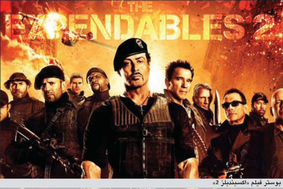
بوستر فيلم «اكسبندبلز 2»

لوس أنجيليس - أ.ف.ب: تصدر فيلم الحركة «اكسبندبلز 2» شباك التذاكر في أميركا الشمالية للأسبوع الثاني على التوالي، تلاه فيلم «ذي بورن ليغيسي»، بحسب الأرقام الصادرة عن شركة «أكزبيكتور ريليشنز».