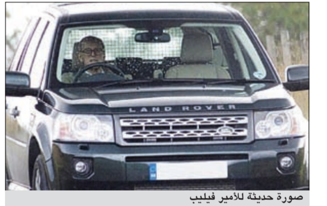
صورة حديثة للأمير فيليب

لندن - أ.ف.ب: خرج الأمير فيليب زوج الملكة إليزابيث الثانية إلى العلن الأحد، للمرة الأولى بعد خروجه من المستشفى في 20 أغسطس. وذهب الزوجان بالسيارة إلى الكنيسة لحضور القداس، بالقرب من قصر بالجوال في اسكوتلندا، حيث يقطنان في الصيف. وكان الأمير فيليب البالغ من العمر 91 عاما قد خرج من مستشفى أبردين في اسكوتلندا مبتسما في 20 أغسطس، بعد أن أمضى فيه 5 ليال إثر انتكاسه بعد التهاب في البول في يونيو. لكنه لن يرافقه زوجته الأربعاء إلى حفل افتتاح الألعاب البارالمبية في لندن لأنه ما زال يتعافى. وقد أنخل دوق أدنبره المستشفى 3 مرات منذ ديسمبر. فقبل عيد الميلاد، خضع لجراحة طارئة إثر انسداد في أحد شرايينه التاجية. ثم أصيب بالتهاب في البول في يونيو بعد أن أمضى ساعات عدة واقفا تحت المطر خلال الاستعراض المائي الضخم الذي أقيم على نهر التايمز بمناسبة التوييل الماسي للملكة إليزابيث الثانية.