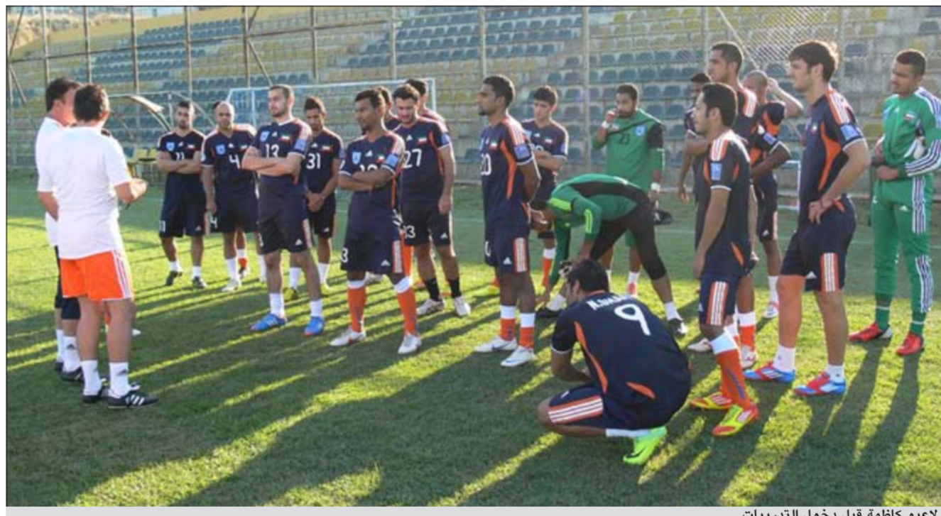
لاعبو كاظمة قبل دخول التدريبات

عليه بعد مباراة اليوم ان تمكن من اثبات نفسه. كان الفريق قد خاض امس فترتين تدريبيتين تركّزت الاولى على بعض التمرينات الخفيفة وبعض الجمل التكتيكية بينما