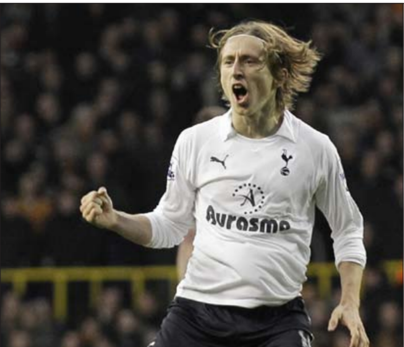
لوكا مودريتش سيكون إضافة مهمة لتشكيلة ريال مدريد

وحافظت اليلاروسية فيكتوريا ازارنكا والبولندية انيسكا رادفانسكا على المركزين الاول والثاني في تصنيف الالعبات. وضعدت الصينية لي نا مرتبة واحدة وباتت في المركز الثامن بدلا من اللندماركية كارولين فوزنياكي التي اصبحت تاسعة.