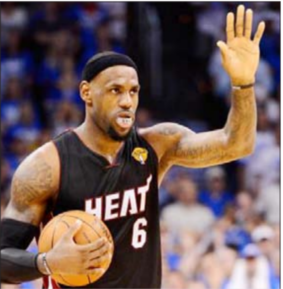
ليبرون مرشح ليكون بديل «الأسطورة» جوردان في «سبيس جام 2»

دائماً ما تجرى مقارنة بين ليبرون جيمس ومايكل جوردان، وإذا كانت أحلام جيمس تتحقق، عليك أن تكون قادراً على مقارنة مهاراته في مقامة كل شيء آخر.