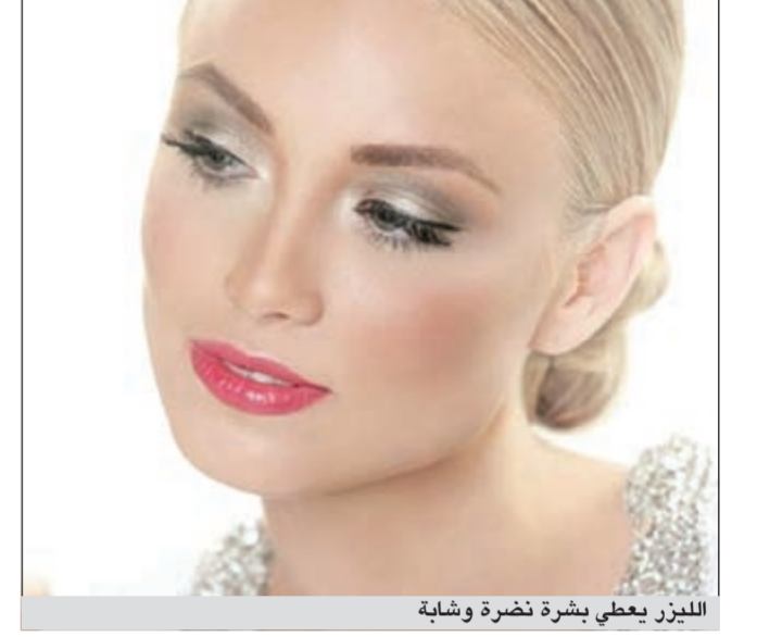
الليزر يعطي بشرة نضرة وشابة