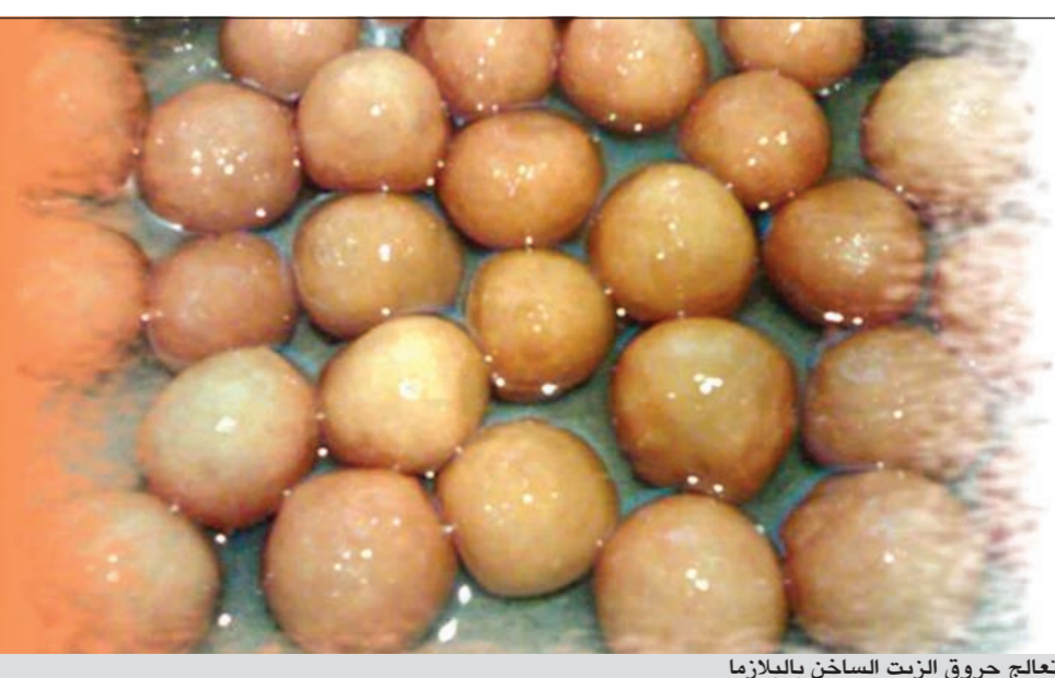
تعالج حروق الزيت الساخن بالبلازما

خلال شهر، ولكن للجسم ربما يمر شهران حتى يبدأ بالظهور فالقضية ليست قضية ليزر، ولكنها تتعلق بدورة نمو الشعر وهي من أربعة إلى ستة أسابيع بالنسبة للليزر للوجه وبالنسبة للساخن فهي من ثمانية إلى عشرة أسابيع لكل ساق، كذبة كبيرة من القول أن الليزر قد يكفي بجلسة أو جلستين ولكنه سلسلة من الجلسات تبعاً لكل حالة. دورة العلاج بالليزر لصغيرات السن من ستة إلى سنة ونصف سنتين وللأخريات من سنتين إلى سنتين ونصف، ليختفي الشعر بالكامل، وبالطبع مع العلاج بعد خمسة أو ستة شهور يبدأ الشعر يخف وتضخم النتائج، ولكنه لا ينتهي كلياً، ولا تحصل السيدات على النتيجة المطلوبة إلا بعد ستة إلى ستة ونصف الليزر إزالة الشعر من الوجه، أو سنتين إلى سنتين ونصف لإزالة الشعر من الجسم وحتى هذه الفترة الزمنية لكل من الوجه أو الجسم نتحدث عن نتائج بنسبة 80٪ فقط، حتى تكون النتيجة أفضل ولكن لا أعد بنتيجة أفضل من 80٪.