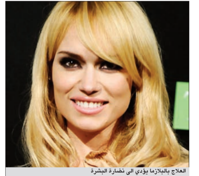
العلاج بالبلازما يؤدي إلى نضارة البشرة

سواء كانت في البشرة، أو في الشعر، لعلاج الندب وعلاج العضلات وعلاج كل شيء ونتائجها غير محدودة فقط في الوجه ولكن لنمو الشعر، وللملح ولإحياء الخلايا، وهو علاج آمن لأنه مأخوذ من دم المريض نفسه، لا يتم خلطه مع أي شيء فليست كل الآلات التي تستخدم لعلاج البلازما آمنة أو نافعة فمئة آلة خاصة تمت الموافقة عليها من قبل الجمعية الأميركية F.D.A وهي تعطي نتائج موقوفة. تقشير البشرة