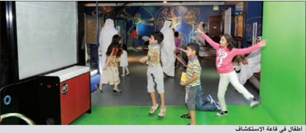
أطفال في قاعة الاستكشاف