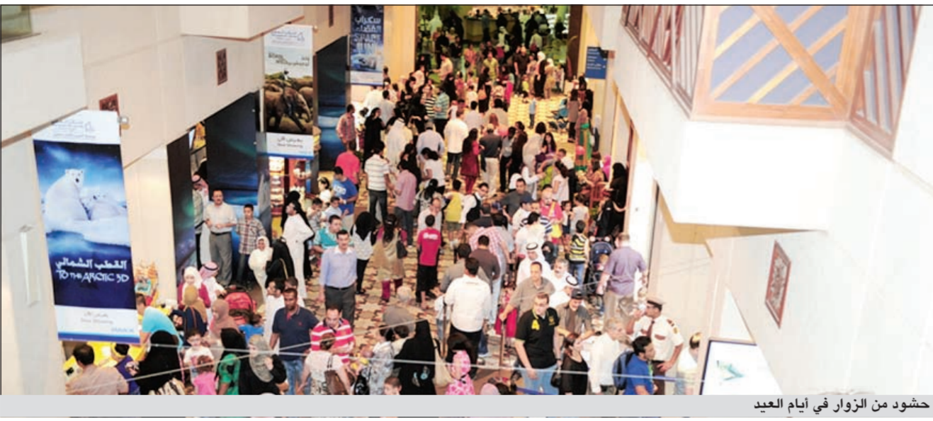
حشود من الزوار في أيام العيد