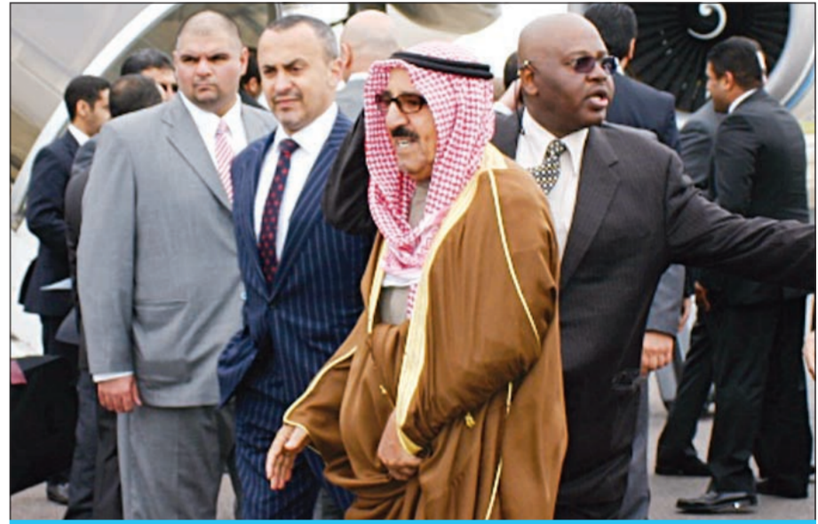
صاحب السمو الامير الشيخ صباح الاحمد لدى وصوله الى المملكة المتحدة

جدد المجتمعون في ساحة الإرادة مساء أمس مطالبهم المعلنّة مسبقاً والمتمثلة في رفض انفراد الحكومة بتغيير قانون الدوائر الانتخابية، ورفض اقصاء القضاء في القضايا السياسية مع المطالبة بنظام برلماني كامل وحكومة منتخبة داعين الى تحقيق الإصلاح السياسي الشامل من خلال الدائرة الواحدة وفق القوائم النسبية. وكان رئيس مجلس الأمة جاسم الخرافي قد دعا الى احترام الاجراءات الدستورية وعدم التعامل بالزواجية مع مواد الدستور، مشيراً الى ان الالتزام بالدستور هو السبيل للخروج من الازمات السياسية. وقال الخرافي خلال مؤتمر صحافي عقده في مجلس الأمة امس ان ذهاب الحكومة الى المحكمة الدستورية هو حق دستوري لا خلاف عليه ولا بد من احترام هذا الحق، مشدداً على ان صدور مراسيم الضرورة في فترة غياب المجلس يعني ايضاً حقاً دستورياً لصاحب السمو الامير «ولدينا سابقة في العام 1981 حيث صدر مرسوم في شأن الدوائر الانتخابية..» وأضاف: سادعو الى عقد جلسة خاصة لنظر الاستقالات الجديدة التي اعلن عنها بعض النواب ولم