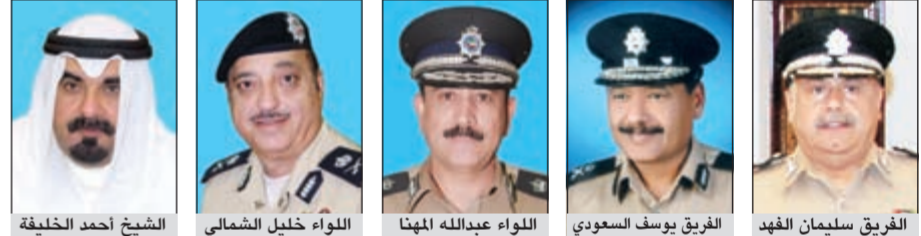
الفرقي سليمان الفهد، الفرقي يوسف السعودي، اللواء عبدالله المهنا، اللواء خليل الشمالي، الشيخ احمد الخليفة

منهم فريقان و3 أئوية وترقية 900 ضابط في نوفمبر «الداخلية» مددت لـ 5 وكلاء مساعدين لسنتين وحركة تدوير وشبكة بين المديرين العامين