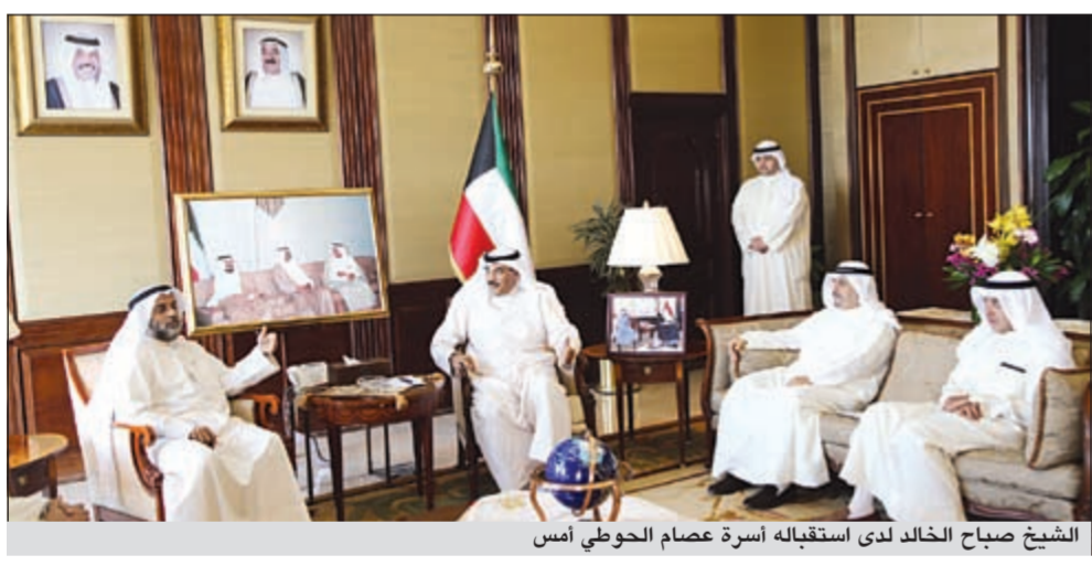
الشيخ صباح الخالد لدى استقباله أسرة عصام الحوطي أمس