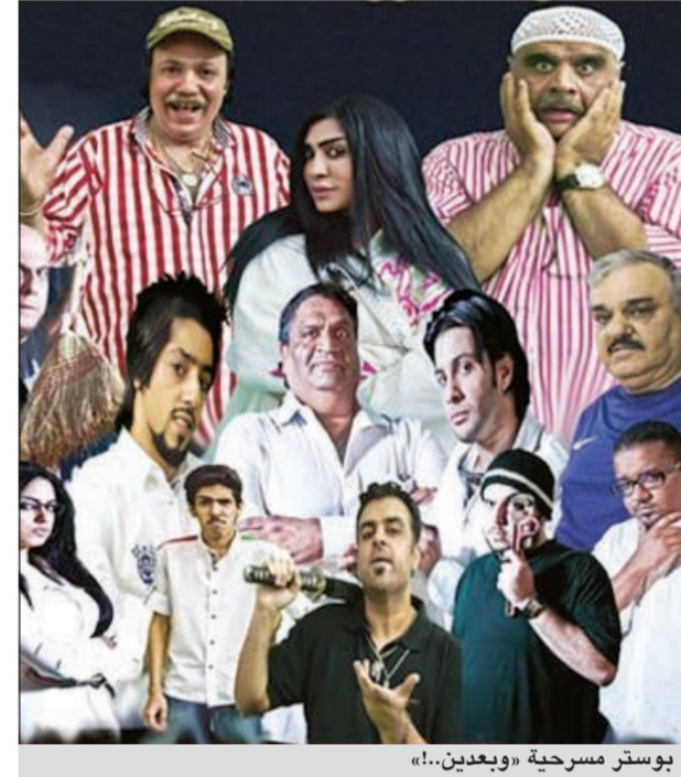
بوستر مسرحية «وبعدين»

المسرحية بدر محارب. ونجحت فرقة مسرح الخليج العربي في استقطاب النجم المصري طلعت زكريا