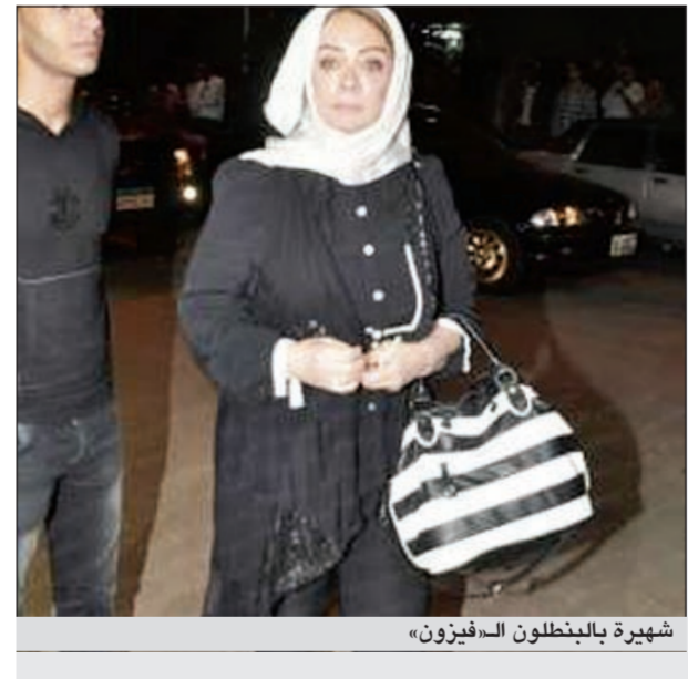
شهيرة بالطنلون الـ «فيزون»

تداول نشطاء على الـ «فيسبوك» صورة للفنانة المعتزلة شهيرة زوجة الفنان محمود ياسين ساخرين من ارتدائها بطنلون ضيق «فيزون» وظهورها بهذا الشكل. وتعجب بعضهم، بحسب ما ذكر موقع «دنيا الوطن»، كيف تظهر الفنانة المعتزلة بهذا الشكل بعد سنوات من ارتدائها الحجاب واعلانها اعتزال الفن وابتعادها عن الأضواء وانها ثابت وندمت على كل ما فات. واعتبر بعض العلقين ان هذا شيء محزن فيما توقع البعض ان تعود شهيرة للتمثيل كباقي زميلاتهن اللواتي عدن الى عالم الفن بعد سنوات من الاعتزال.