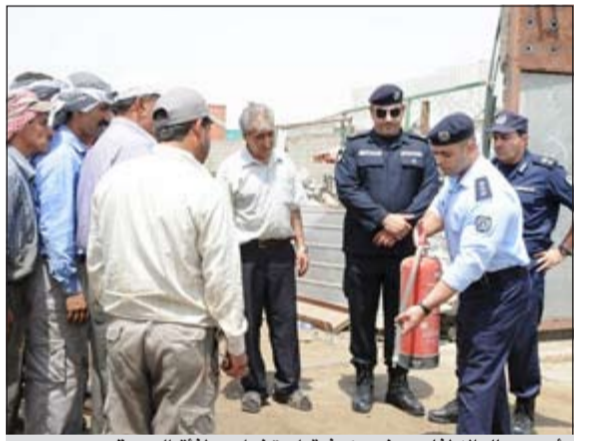
أحد رجال الإطفاء يوضح كيفية استخدام مظفة الحريق