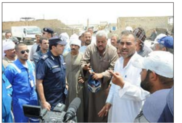
مخاضرة في أمفرة عن مظفة الحريق

وأوضح الأمير أن الهدف من هذه الحملة التثقيفية والتوعوية أيضاً إرشاد الموجودين والعاملين حول كيفية التقليل من نسبة الخسائر من أرواح وممتلكات، مشيداً بتفاعلهم مع إدارة الإطفاء والاستماع الى توجيهاتها.