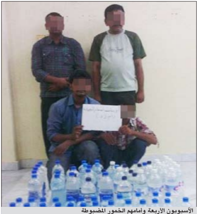
الأسويين الأربعة وامامهم الخمور المضيوة

تاجير مساكن وملاحق في منازل الكويتيين للوافدين العزّاب، مؤكداً ان هذه المنازل سيتم توقيف من بداخلها باعتبار أنها مناطق مخصصة لإقامة المواطنين ووجود العمالة الوافدة بها يشكل خطراً على القاطنين فيها.