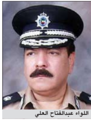
اللواء عبدالفتاح العلي