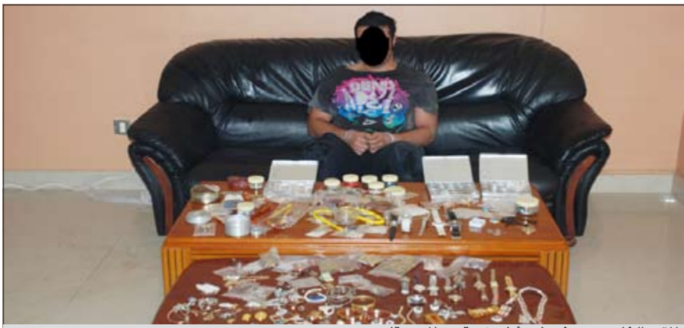
المتهم الخامس بعد ضبطه وامامه كمية من المسروقات

اغلقت وزارة الداخلية ملف قضايا الاعتصاب المتفرقة بالسطو بتوقيف المتهم الخامس، وقالت وزارة الداخلية في بيان لها انه وفي إطار جهود وزارة الداخلية للحد من انتشار الجريمة وتقديم مرتكبها للعادلة، تمكنت إدارة مباحث محافظة العاصمة ومباحث محافظة حولي من ضبط تشكيل عصابي مكون من خمسة أشخاص من جنسيات مختلفة تخصص في السرقة بالإكراه واغتصاب بعض الخادمت أثناء عملية السرقة. وازداد البيان أنه وردت في الأونة الأخيرة العديد من البلاغات المقدمة من بعض المواطنين الى عدد من المخافر بتسجيل قضايا ضد مجهول، وذلك لتعرض منازلهم للسرقة بالإكراه واغتصاب بعض الخادمت أثناء عملية السرقة. وقد أفاد الضحايا بأن الجناة يأتون الى المنازل ويطرقون الأبواب بحجة أن لديهم اغراض يرغبون في توصيلها الي صاحب المنزل، وعندما تقوم الخادمة بفتح الباب يتم مهاجمة كل من يكون داخل المنزل ووضعهم في إحدى الغرف تحت تهديد السلاح حتى ينهتوا من جمع المسروقات القيمة من داخل المنزل والهروب بها، وقد تعرضت بعض الخادمت للاغتصاب من المتهمين أثناء ارتكاب تلك الجرائم. وتضمن البيان أنه يتكثف التحريات وبعد ورود المعلومات الى إدارة مباحث محافظة العاصمة بأن المتهم الأول بحوز أسلحة نارية غير مرخصة، وقد تغيرت حالته