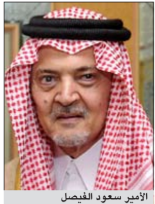
الأمير سعود الفيصل

وزير الخارجية بعد العملية الجراحية، التي أجريت له، فقد تم صباح أمس فصل جهاز التنفس المستخدم عادة بعد العمليات الجراحية المماثلة للمعملية التي أجريت له، وذلك بنجاح تام». وأكد البيان أن الأمير سعود الفيصل «سيفادر المستشفى خلال الأيام القليلة المقبلة». وكان الديوان الملكي السعودي أعلن في 11 أغسطس أن وزير الخارجية البالغ من العمر 72 عاماً خضع لعملية ناجحة في الأمعاء وحالته مستقرة. وقال المصدر نفسه في بيان