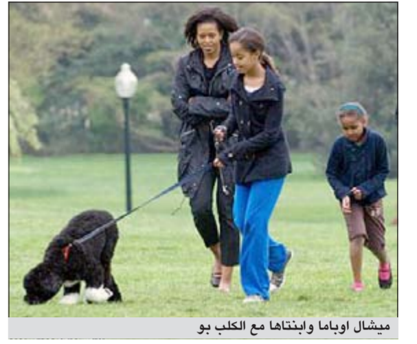
ميشال أوباما وابتنتها مع الكلب بو

يو.بي.أي: كشف الرئيس الأميركي باراك أوباما أن «الكلب الأول» بو يتبع حمية غذائية بعدما زاد وزنه. وأفاد موقع «يو إس نيوز & وورلد ريبورت» الأميركي بأن أوباما كشف عن حمية الكلب «بو» عندما فاجأ مجموعة من الأولاد الفائزين بمنافسة أطلقتها السيدة الأولى الأميركية ميشال عن «الوجبة الغذائية الصحية»، فيما كانوا يتناولون الطعام في البيت الأبيض. وقال أوباما «أود أن أطلب منكم ألا تتركوا أي مخلفات طعام تقع على الأرض لأن بو يتبع حمية حاليا وسياكل كل شيء يراه، خصوصا إذا كان من بين الأطعمة اللذيذة التي حضر نموها». يشار إلى أن السيدة الأولى الأميركية أطلقت قبل 3 سنوات حملة لمحاربة بدانة الأولاد تضمنت برنامجا للتمارين الرياضية وزرع حديقة عضوية في البيت الأبيض. وكانت ابنتا أوباما حصلتا على الكلب «بو» في العام 2009، عندما كان في الشهر السادس من العمر وهو من نوع كلاب المياه البرتغالية. يذكر أن «كلاب المياه البرتغالية» تناسب الأشخاص الذين يعانون من الحساسية خصوصا أن عائلة أوباما تعاني هذه المسألة أهمية كبيرة بسبب معاناتهم من الحساسية.