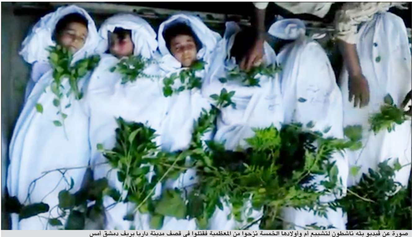
صورة عن فيديو بثه ناشطون لتشيع أم واولادها الخمسة نزحوا من المخيمية قتلوا في قصف مدينة داريا بريف دمشق أمس