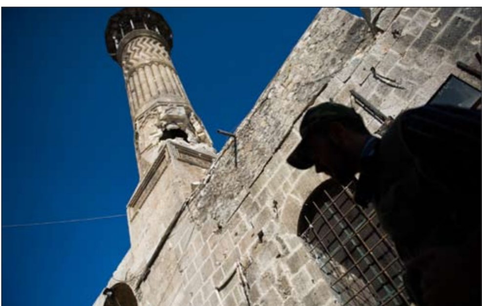
أحد المساجد الأثرية من العهد المملوكي تأثر بالقصف في شارع النصر بحلب

11 أغسطس الجاري. وأشار مصدر دبلوماسي في تصريح خاص للصحيفة الى أن «الاجتماع مهم للغاية لتبادل الآراء والمعلومات الاستخباراتية المتعلقة بسورية»، مضيفاً أن الإدارة الأميركية بدأت تنظر بجدية وحساسية لازمة السورية رغم انتخاباتها الرئاسية القريبة. ولم يستبعد المصدر المتطرق للعديد من الموضوعات بالاجتماع وأهمها، المنطقة العازلة: التي سيتم انشاؤها على الحدود مع سورية بحال استمرار زيادة أعداد الهجرة الجماعية الى تركيا، ثم المساعدات الإنسانية: وسيتم تقديم المساعدات الإنسانية عند نقطة الصفر وقد يتم تقديمها داخل الاراضي السورية بحال حدوث مزيد من التدهور في الوضع السوري. وأشار المصدر الدبلوماسي الى انه فيما يتعلق بمنظمة حزب العمال الكردلي «بي كيه كيه» وتنظيم القاعدة: ستخذ الخطوة الاولى لمنع تمركز أعضاء المنظمة الانفصالية «بي كيه كيه» وعناصر تنظيم القاعدة بالجانب السوري استغلالاً لفرصة فراغ السلطة في شمال سورية. من جهة اخرى، قالت الأمم المتحدة أمس الأول ان إيران تزود سورية بالأسلحة فيما يبدو مع مضي الصراع الذي بدأ بالتفاضة شعبية سلمية مناهضة للرئيس بشار الأسد مسافات أبعد على طريق الحرب الأهلية. ويؤيد اتهام الأمم المتحدة اتهامات مسؤولين غربيين لإيران بدعم الأسد بالمال والسلاح والمعلومات في جهوده لسحق