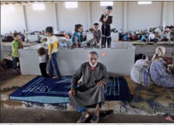
عشرات التازحين عالقين عند معبر باب السلام على حدود تركيا

دمشق - أ.ف.ب: أعلن نائب وزير الخارجية السوري فيصل المقداد أمس أن بلاده ستتعاون مع الموقف الدولي الجديد الى سورية الأخضر الإبراهيمي، متوقفاً أن يعمل هذا الأخير على «عقد حوار وطني» سوري «أسرع وقت». وقال المقداد بعد لقاء وداعي مع رئيس بعثة المراقبين الدوليين في سورية الجنرال باكر غاي باللغة الإنجليزية «ابلغنا الأمم المتحدة موافقتنا على تعيين» الإبراهيمي و«نحن نتطلع الى (...) معرفة الأفكار التي سيقدّمها لحلّول محتملة للمشكلة هنا».