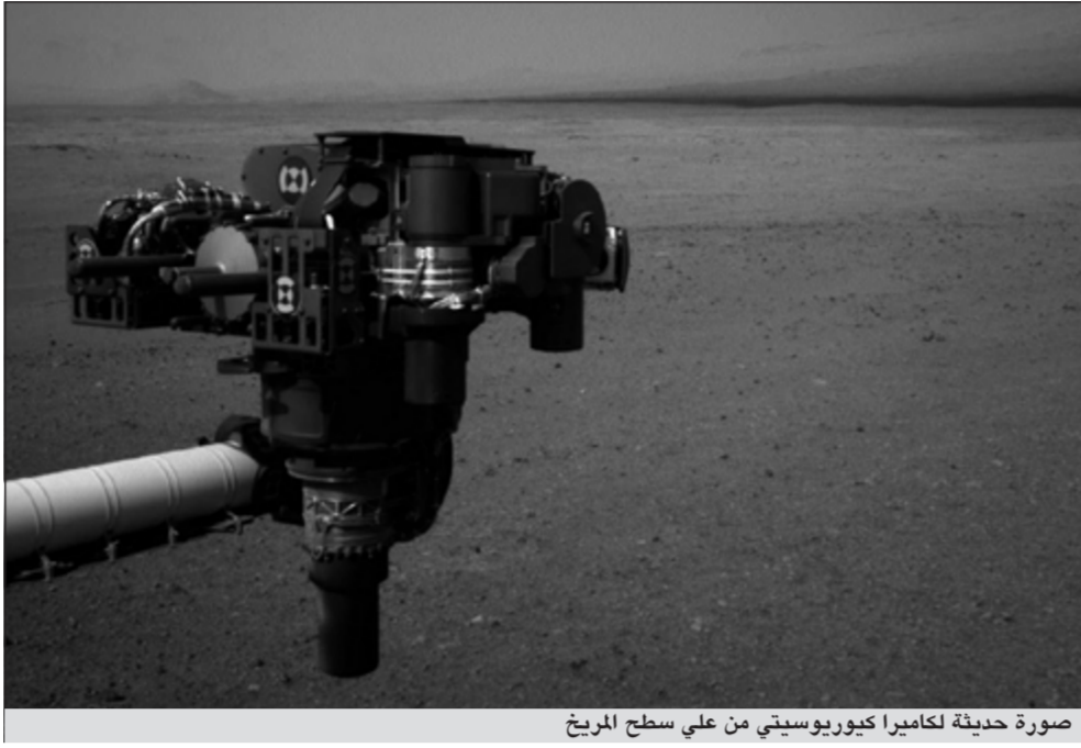
صورة حديّة لكاميرا كيوريوسيتي من على سطح المريخ

المهمة التي تستمر عامين وبلغت تكلفتها 2,5 مليار دولار. ويعتقد العلماء أن الجبل المعروف باسم ماونت شارب يمثل بقايا مواد الحياة الميكروبية.