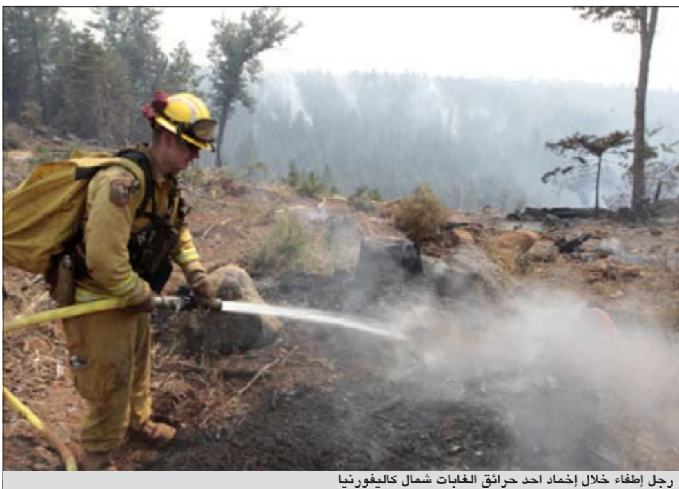
رجل إطفاء خلال إخماد احد حرائق الغابات شمال كاليفورنيا