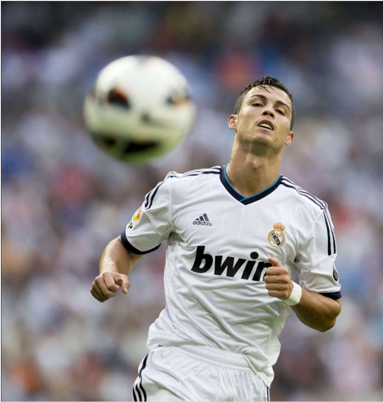
كريستيانو رونالدو يامل في صنع الغارق في «كلاسيكو إسبانيا»