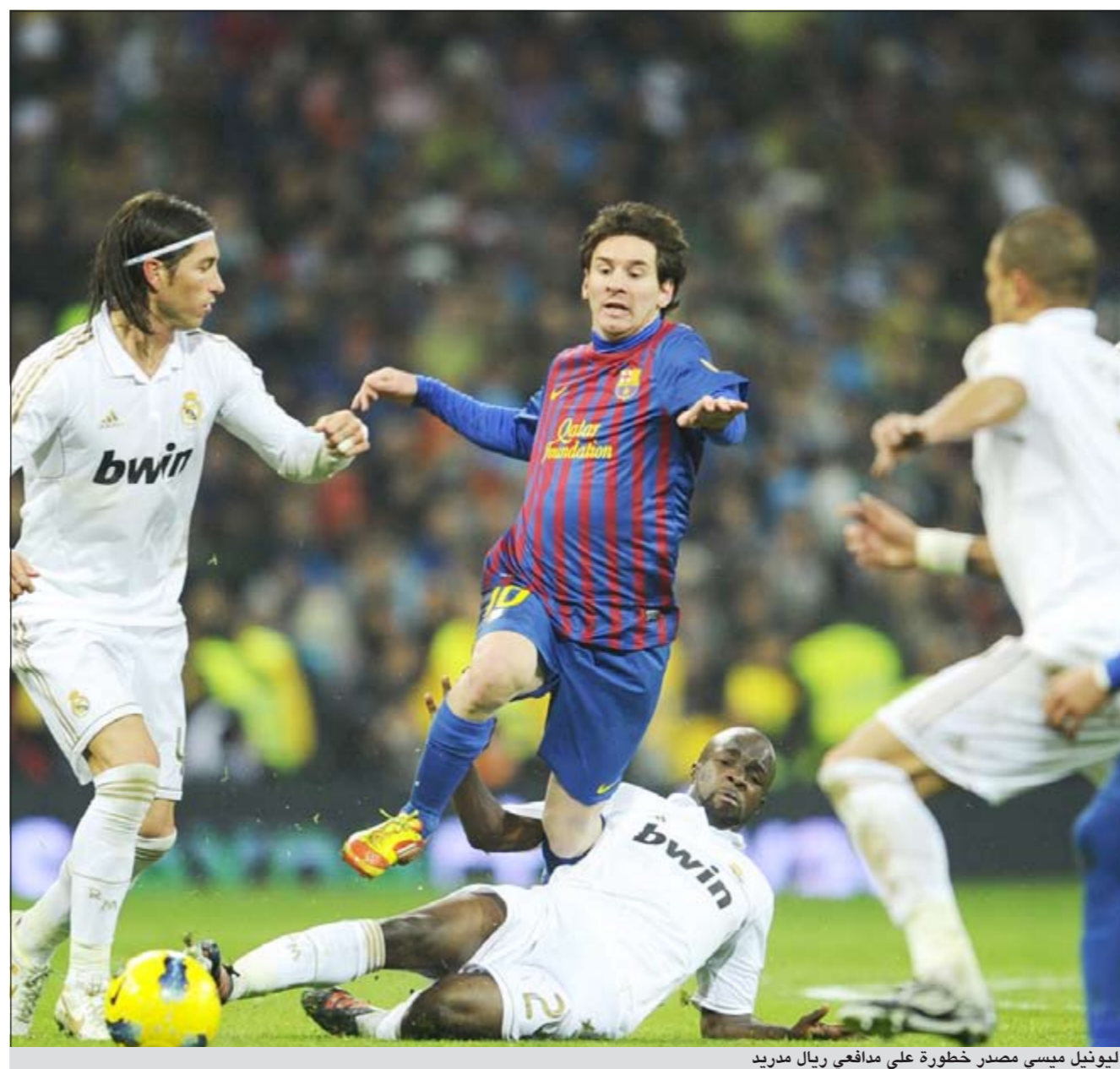
ليونيل ميسي مصدر خطورة على مدافعي ريال مدريد

كشفت صحيفة «الدابلي ميل» الانجليزية ان أزمة تلوح في أفق المهاجم البرتغالي لنادي ريال مدريد بسبب مشكلة بينه وبين خطيبته العارضة الروسية ايرينا شايبك، في ظل عدم التوافق بينهما وبين والده رونالدو الأمر الذي يؤثر وبشكل كبير على أداء البرتغالي في المباراة الأولى لفريقه امام فالنسيا في الدوري الإسباني بحيث فشل رونالدو في هز الشباك بعد ان سدده 4 مرات فقط على الرمى.