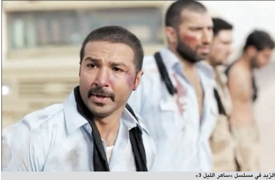
الزيد في مسلسل «ساهر الليل 3»