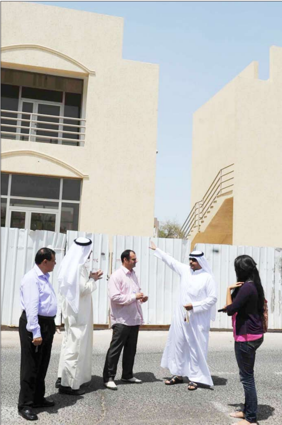
رئيس مجلس الإدارة يضع الصحافيين أمام توسعة سوق الرابية رداً على الاتهامات بأنه لم توضع فيه لجنة واحدة