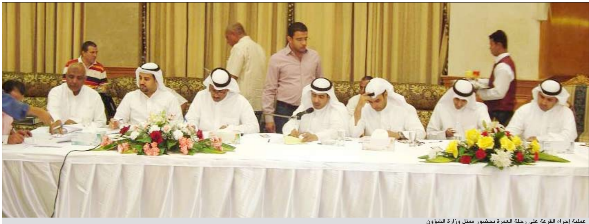
عملية إجراء القرعة على رحلة العمرة بحضور ممثل وزارة الشؤون

الأرباح والأمور المالية وردا على ما اعتبره الخشباب القشة التي قصمت ظهر البعير بأن مجلس الإدارة لم يوزع أرباحاً على المساهمين منذ 7 سنين ذكر أن هذا مما يكشف زيف المدعين فالجمعية لم توزع أرباحاً منذ 5 سنين فقط مع أنها تحقق بفصل الله تعالى أرباحاً بشكل سنوي وقمنا في أعوام 2007 بتوزيع أرباح على المساهمين، وأما السبب في عدم التوزيع فهو ورود كتاب إلينا من وزارة الشؤون يلزمنا