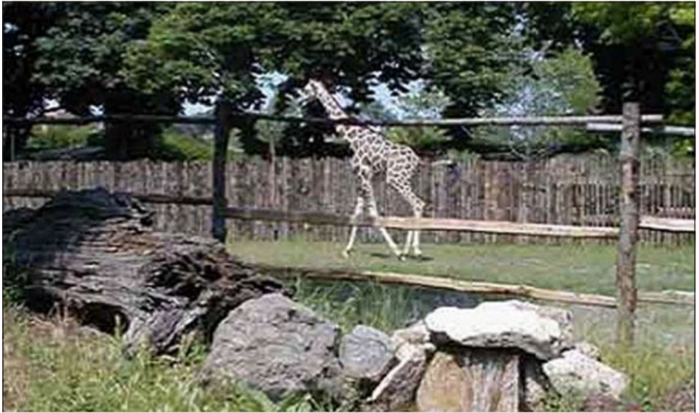
الزرافة الجديدة في حديقة الجيزة

القاهرة - العربية: احتفل عشرات الآلاف بأول أيام عيد الفطر المبارك في حديقة الحيوان بالجيزة، وسط تواجد أممي ملحوظ، وخطفت الزرافة التي ضمتها الحديقة مؤخرًا، لأول مرة منذ سنوات طويلة، انظار الحضور حسبما نقلت «المصري اليوم».