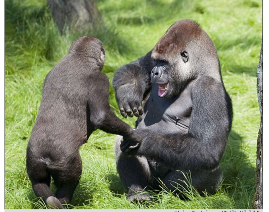
الشقيقان تقابلان بعد غياب 3 سنوات

لندن - وكالات: جمع شمل الأسرة بعد غياب طويل قد يكون مرجحاً للغاية، لكن ربما كان الأمر أسهل في عالم الحيوانات أو بالأخص مع حيوانات الغوريلا. حيث استطاع اثنتان من حيوانات الغوريلا أن يتجاوزا صعوبة الموقف بعد لم شملهم مرة أخرى من خلال معانقة دافئة. ووفقاً لصحيفة «ديلي ميل البريطانية»، فإن كيشو الغوريلا وأخيه الأصغر «ألف»، قد ابتعدا عن بعضهما البعض لما يقرب من 3 سنوات، بعد أن تم إرسال كل منهما إلى حديقة حيوان مختلفة، وقد اجتمعا مرة أخرى هذه الأسبوع في منزلهما الجديد بحديقة لوجنلجيت سفاري، ورحبا ببعضهما البعض بأذرع مفتوحة، تلتها مصافحات بالاعتناق، والأيدي. وكان قد تم إرسال كيشو إلى حديقة حيوان لندن، وعلى الرغم من أنه مصاب