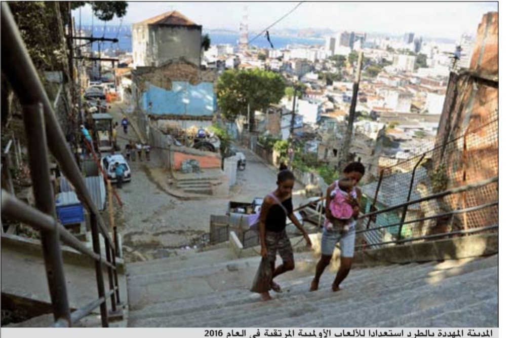
المدينة المهدة بالطرد استعدادا للألعاب الأولمبية المرتقبة في العام 2016

ريو دي جانيرو - أ.ف.ب: في فيلا أوتودرومو الواقعة على ضفاف بحيرة جاكاريياغا في غرب ريو دي جانيرو، بنام السكان البالغ عددهم ثلاثة آلاف نسمة بهناء في غياب تجار المخدرات والميليشيات، لكنهم يواجهون اليوم خطر طردهم استعدادا للألعاب الأولمبية المرتقبة في العام 2016. تقع مدينة الصفيح الصغيرة هذه بالقرب من المتنزّه الأولمي الذي تسعى البلدية إلى بنائه لاستضافة الألعاب الأولمبية للعام 2016، ومن المفترض أن يعبرها قريبا طريق سريع جديد. وقد ارتفعت أسعار العقارات بشكل جنوني في المنطقة وتعزز البلدية نقل مدينة الصفيح تلك إلى أرض مجاورة حيث قررت بناء مساكن اجتماعية.