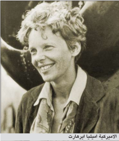
الأميركية إميليا إيرهارت

واشنطن - أ.ف.ب: عثر فريق البحث عن الطائرة الأميركية إميليا إيرهارت التي فقد أثرها في المحيط الهادئ في العام 1937، على «بقايا لأشياء مصنعة» تحت الماء يعتقد أنها عائدة إلى طائرتها، بحسبما أعلن باحثون. وظهرت صور التقطها فريق «مشروع إيرهارت» وجرى تحليلها في المختبر «أشياء مصنعة مبعثرة» تحت الماء إلى الغرب من جزيرة نيكومارورو في جزر كيريباتي في المحيط الهادئ، بحسبما أعلن الباحثون في المهمة. ففي شهر يوليو، قام أعضاء البعثة وهي الثانية من نوعها في 23 سنة، بتصوير قاع المحيط قبالة سواحل الجزيرة حيث يعتقد أن الطائرة سقطت وأن إميليا إيرهارت تمكنت من النجاة والبقاء على قيد الحياة لوقت قصير. وكادت هذه الطائرة الأميركية تسعى إلى اتمام رحلة حول العالم في موازاة خط الاستواء. وبعد تحليل الصور، تمكن الباحثون من «رؤية عناصر يمكن أن تكون لها علاقة بهبوط الطائرة» بحسبما أفاد ريتشارد جيليسي المدير العام للبعثة. وأضاف انه جرى العثور على «شيء يمكن أن يكون اطارا أو عجلة». واعتبر أن ما جرى تحفيقه «خطوة مهمة جدا، لكننا لا نريد أن نبالغ في أهميتها، علينا القيام ببعض التحليل الأخرى». وتتركز آمال الباحثين على تحديد مكان البقايا العائدة إلى الطائرة. ويقول جيليسي «نحن في المكان الصحيح للبحث، لكن هل ما عثرنا عليه هي البقايا الصحيحة؟ لا نعلم بعد»، مؤكدا في الوقت ذاته أن هذه البقايا إن كانت عائدة إلى طائرة، فهي طائرة إميليا إيرهارت من دون شك لأنه «لم يخفف أثر أي طائرة أخرى هناك». في الثاني من يوليو 1937، كانت إميليا إيرهارت (39 عاما) تقوم مع ملاحها فريد نونان بالرحلة الأخيرة من جولة حول العالم عبر الشرق من خلال المرور بمحاذاة خط الاستواء في طائرة بمحركين من نوع «لوكهيد الكتر».