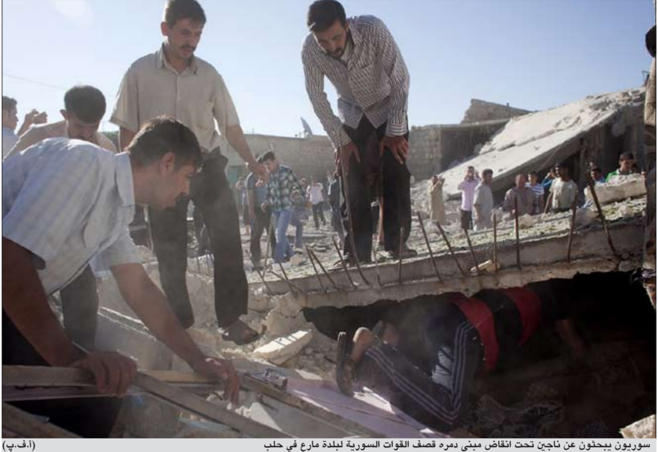
سوريون يبحثون عن ناجين تحت انقاض مبنى دمره قصف القوات السورية لبلدة مارع في حلب

طوكيو - كونا - دب. اكدت الحكومة اليابانية مقتل صحافية من رعاياها يوم امس الاول خلال تغطيتها المعارك الدائرة في مدينة حلب السورية.