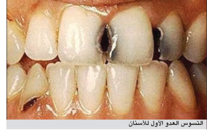
التسوس العدو الأول للأسنان