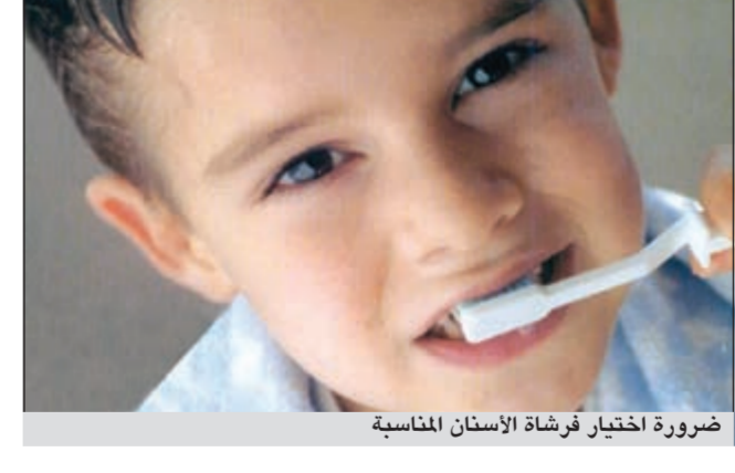
ضرورة اختيار فرشاة الأسنان المناسبة