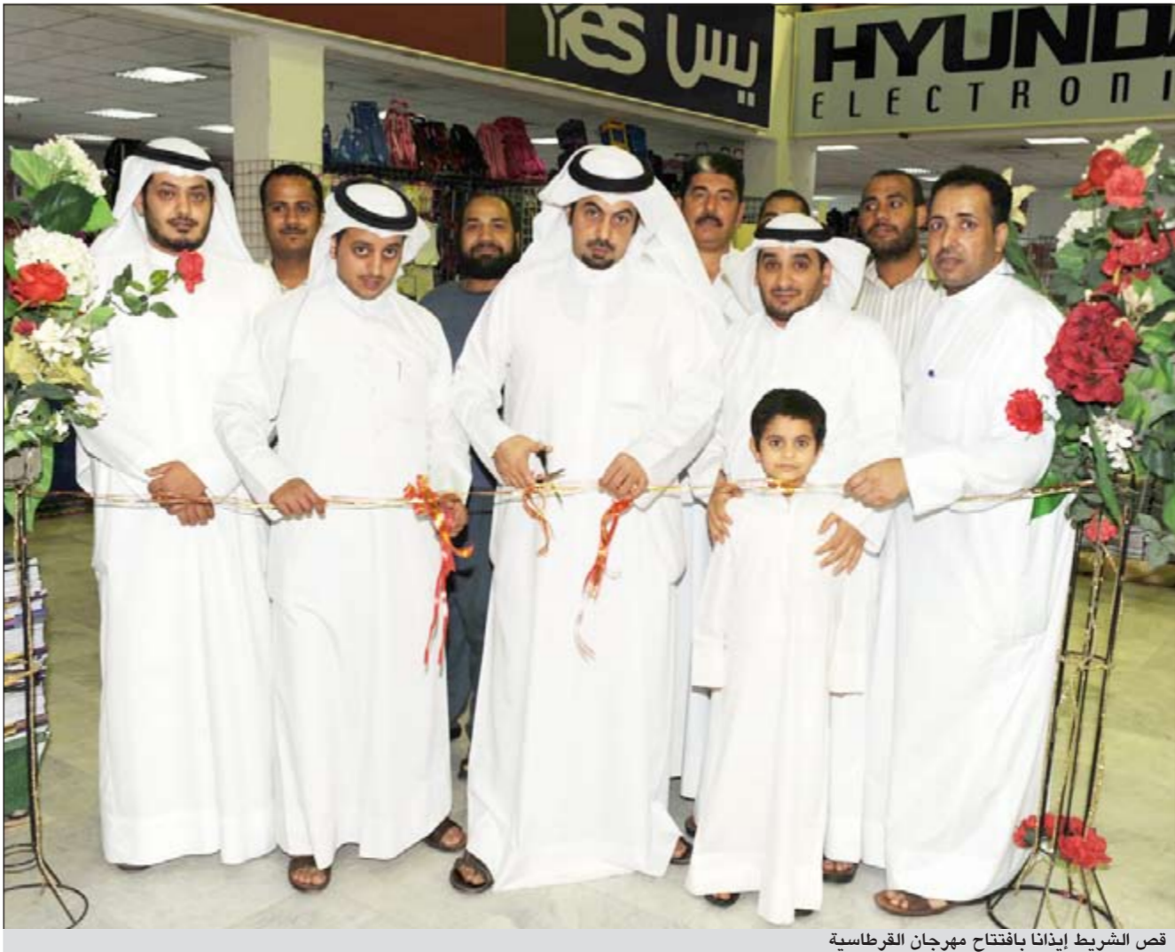
قص الشريط ايدانا بافتتاح مهرجان القرطاسية