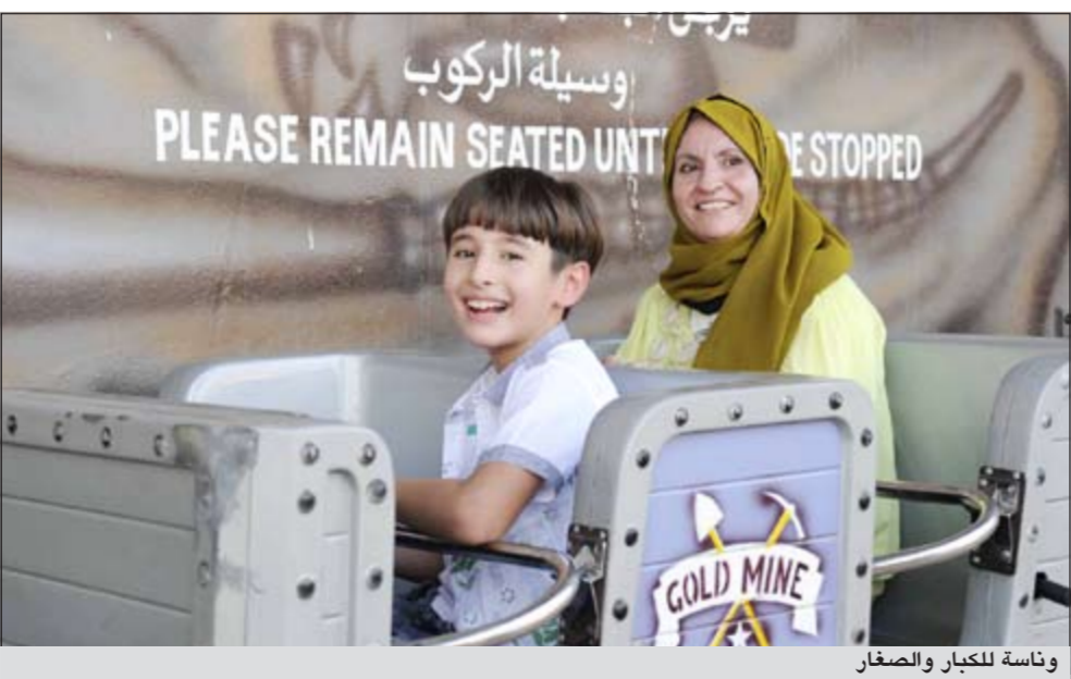
وناسة للكبار والصغار