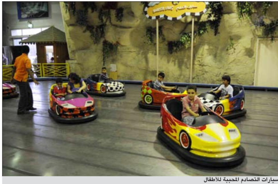
سيارات التصادم المحببة للأطفال

ثم إخوتي وأخواتي ونكمل المسيرة للكبار من الجدة والجد والرجال والأطفال يموتون بابشع الوسائل وكان لم يعد هناك رحمة في القلوب وأصبحنا في غابة، الأخ يقتل أخاه والعائلة مقسمة، مسع أن الحياة قصيرة جداً ولا تستاهل الآ القليل من المحبة والرافة ببعضنا لكي نعيش بسلام وهدوء.