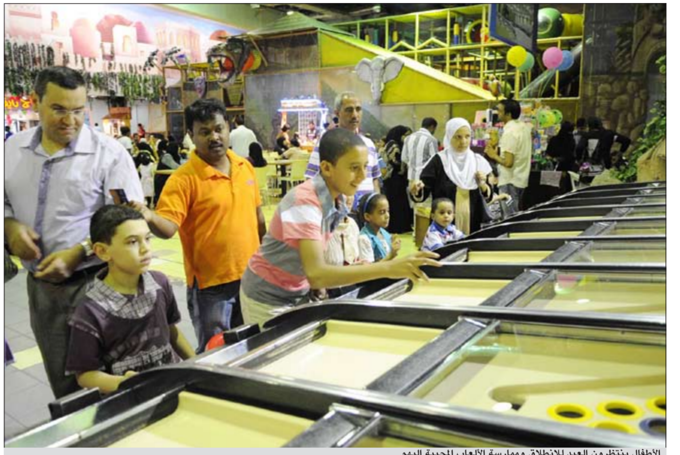
الأطفال ينتظرون العيد للانطلاق وممارسة الألعاب المحببة إليهم

بهجة الأطفال به تنشر السعادة بين الجميع وتدفعهم إلى نسيان وتجاوز أي خلافات