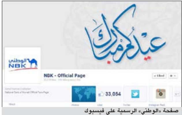
صفحة «الوطني» الرسمية على فيسبوك