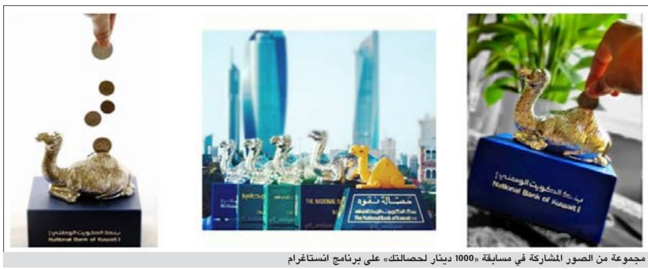
مجموعة من الصور المشاركة في مسابقة «1000 دينار لحصالتك» على برنامج إنستاغرام

ومن جانبها قالت جمانة الكندري عقب عودتها من المؤتمر: هذه المبادرة ليست غريبة على «بيتك»، حيث تنبع من قناعتنا بأهمية دعم التعليم المستمر وتطوير الكفاءات الوطنية لمواكبة آخر ما توصل إليه العلم وأخر المستجدات العلمية على مستوى العالم، أملاً في أن تساهم الكوادر الوطنية في تفعيل وتطبيق هذه التطورات العلمية ليستفيد منها المجتمع الكويتي بمختلف مؤسساته. وأضافت الكندري قائلة: