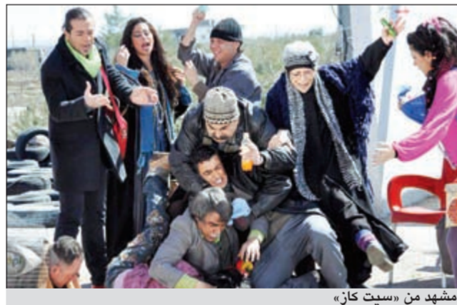
مشهد من «سيت كاز»