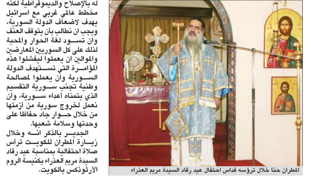
المطران حنا خلال ترؤسه قداس احتفال عيد رقاد السيدة مريم العذراء

وأضاف: «نحن كشعب فلسطيني نطالب بالحرية لنا وللشعوب الأخرى لكننا نرفض