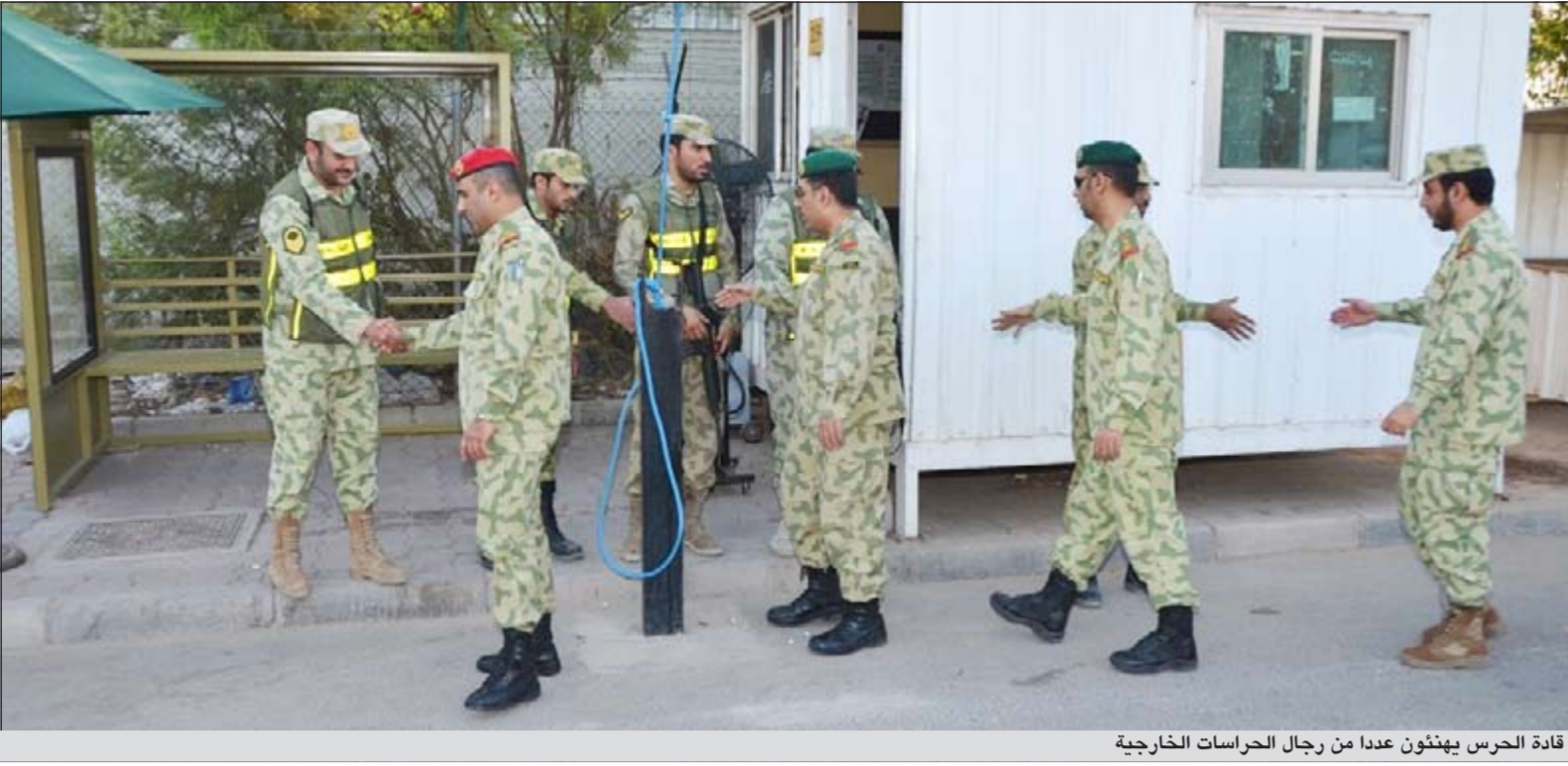
قادة الحرس يهتفون عددا من رجال الحراسات الخارجية