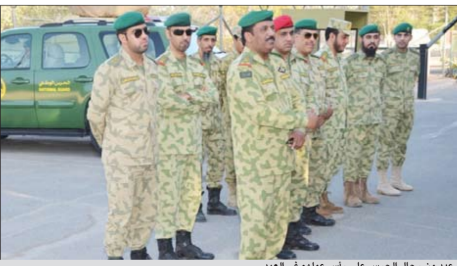
عدد من رجال الحرس على رأس عملهم في العيد