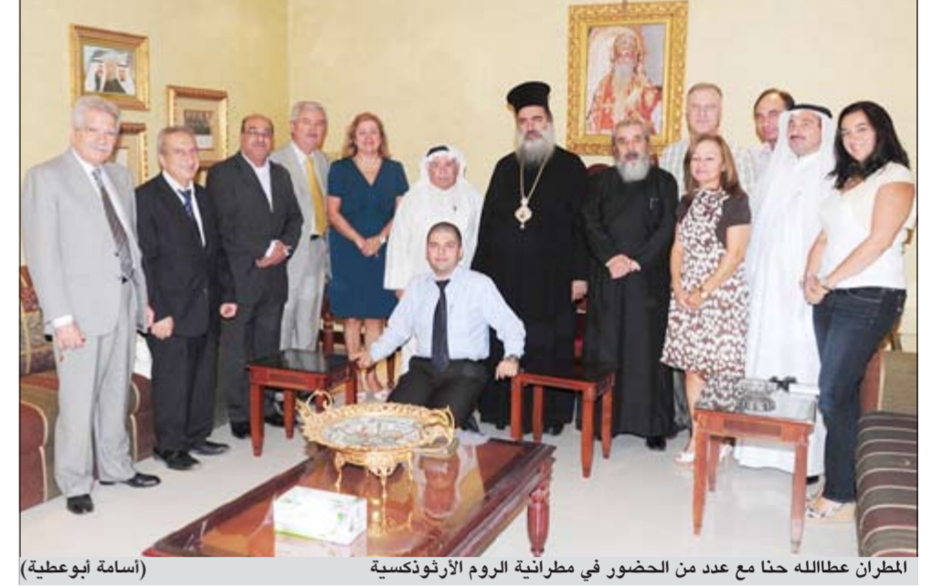
المطران عطالله حنا مع عدد من الحضور في مطرانية الروم الأرثوذكسية

أكد رئيس أساقفة سبسطية الروم الأرثوذكس في القدس المحتلة المطران عطالله حنا على تحفظه بشكل كبير على التدخلات الأجنبية لأنها ليست في صالح شعوبنا العربية، فهذه التدخلات من أجل مصالحهم، فهم يستعملون المفردات الديمقراطية لتدمير مشاريع لا علاقة لها بالديمقراطية لا من قريب ولا من بعيد، وأكد المطران حنا إذا ما أردنا الديمقراطية فلنصنعها نحن ولا نتوقع أن تأتي الديمقراطية من أميركا لأنها ليست من يحدد «من يحكم من». جاء ذلك خلال زيارة المطران حنا لمطراينة الروم الأرثوذكس في الكويت بدعوة من مؤسسة حركة التوافق والحوار الديني الإسلامي - المسيحي، مقدما تحياته