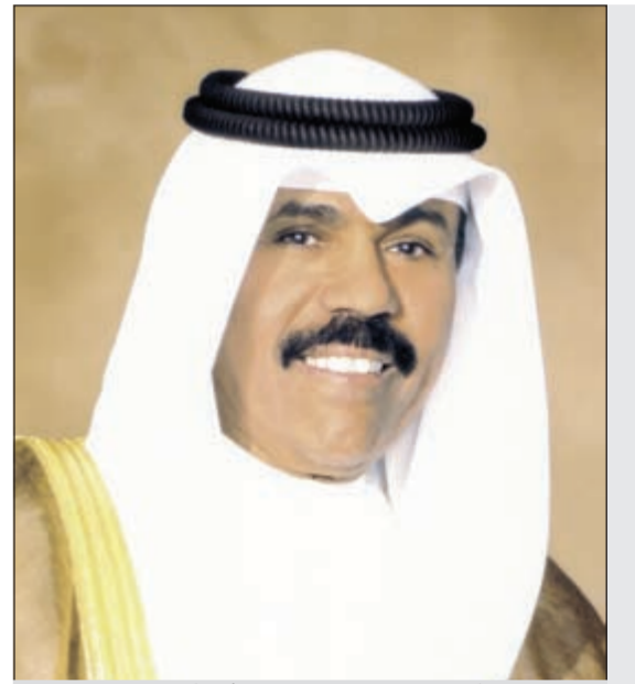
سمو نائب الأمير وولي العهد الشيخ نواف الاحمد

وأضاف المصدر: كما تم رصد عدد من المخالفات لدى المبرات الخيرية، حيث قامت بعض المبرات بجمع التبرعات لصالح جهات خارجية دون وجه حق، بالإضافة إلى تسجيل عدد من المخالفات على بعض المبرات لنشرها إعلانات في الصحف لجمع التبرعات دون موافقة ومخالفة بذلك قانون إشهارها وتم تسجيل المخالفات وتوقيعها تمهيدا لإعداد تقرير تفصيلي يجري خلاله تقييم مفصل