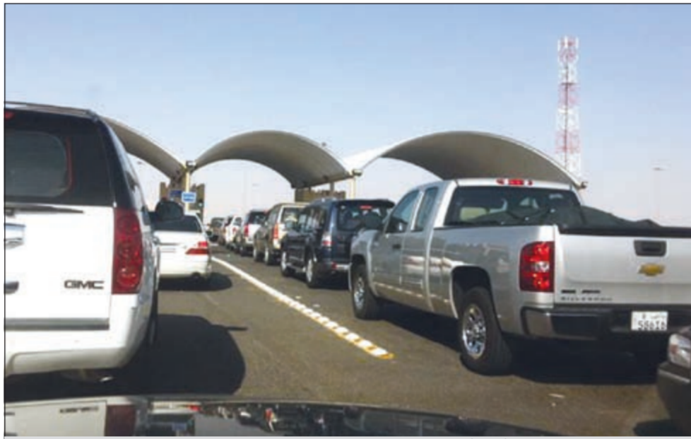
«الداخلية» شغلت كامل الكيائن في منفذ النويصيب لإنجاز معاملات المغادرين والقادمين

53 ألفاً تنقلوا من وإلى الكويت عبر منفذ السالمي والنويصيب في 48 ساعة