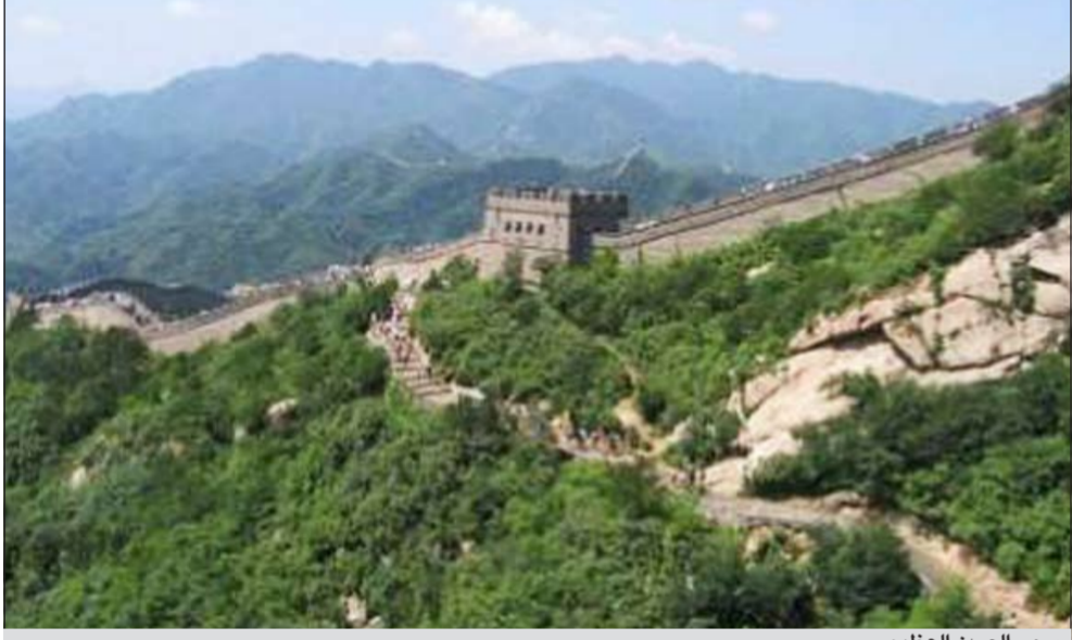
سور الصين العظيم

بيكين - وكالات: انهار جزء من «سور الصين العظيم» شمال الصين بعد أيام من هطول أمطار مستمر.