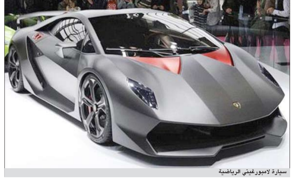
سيارة لامبورغيني الرياضية

ولم تحدد شركة لامبورغيني موعدا محددا للبدء بإنتاج هذه السيارة الفائقة، إلا أنها أعلنت عن نيتها إنتاج 20 سيارة فقط من هذا الطراز الذي تم الكشف عنه في معرض باريس للسيارات في العام 2010، حيث طرحت هذا الطراز كسيارة تجريبية فقط وليست للطراقات.