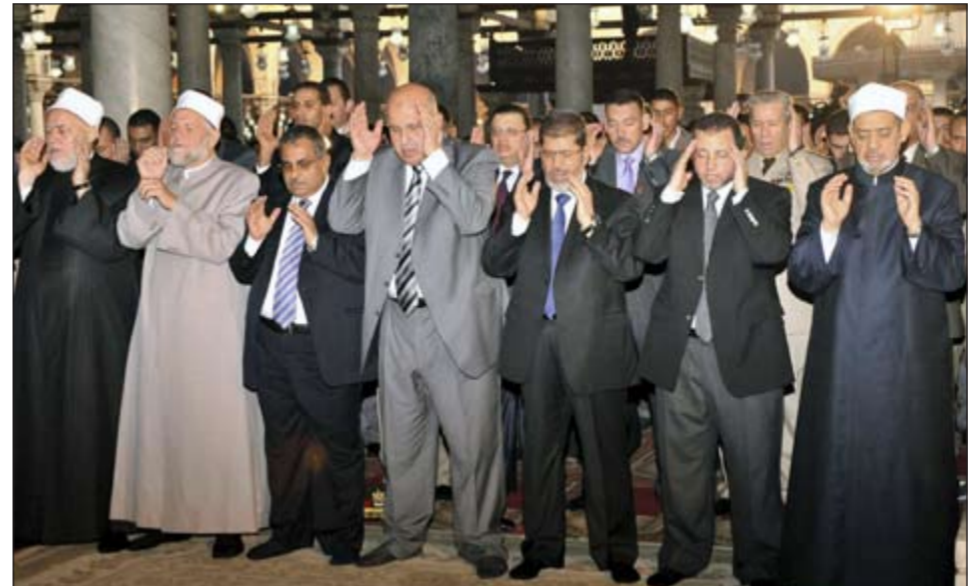
الرئيس د. محمد مرسي وكبار المسؤولين يؤدون صلاة العيد في مسجد عمرو بن العاص التاريخي

القاهرة - كونا: أدى ملايين المصريين صلاة عيد الفطر المبارك امس في الساحات والمساجد بمختلف المحافظات وسط دعوات أئمة المساجد بالتمسك بالوحدة الوطنية والتآلف والعمل من أجل مستقبل أفضل للبلاد على ضوء التغييرات التي شهدها مصر. وأدى الرئيس د.محمد مرسي صلاة عيد الفطر بمسجد عمرو بن العاص جنوبي القاهرة والذي يعد أقدم مساجد مصر وأفريقيا يرافقه نائبه المستشار محمود مكي ورئيس الوزراء د.هشام قنديل وشيخ الأزهر د.أحمد الطيب ووزير الدفاع الفريق أول عبدالفتاح السيسي وكبار رجال الدولة.