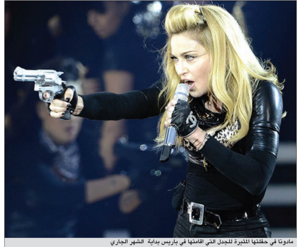
مادونا في حفلتها المثيرة للجدل التي اقامتها في باريس بداية الشهر الجاري

نيس - أ.ف.ب: غطت الجبهة الوطنية الفرنسية ملصقات المغنية مادونا التي تحيي حفلة في نيس، بملصقات أخرى لزعميتها مارين لوبن احتجاجا على بث شريط في حفلات النجمة الأميركية تظهر مسؤولة الحزب اليميني المتطرف مع صليب معقوف.