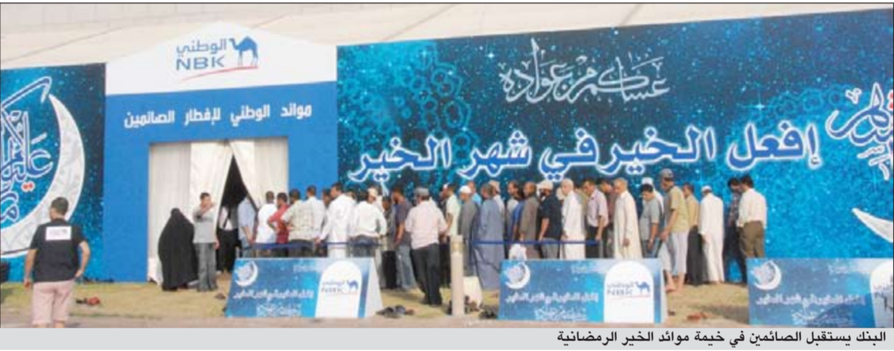
البنك يستقبل الصائمين في خيمة موائد الخير الرمضانية