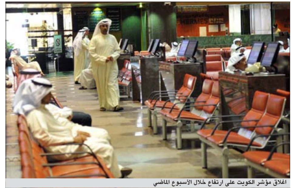
أغلق مؤشر الكويت على ارتفاع خلال الأسبوع الماضي