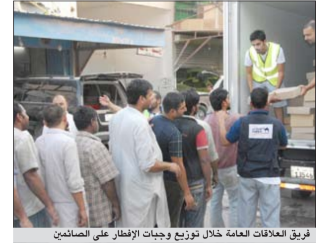
فريق العلاقات العامة خلال توزيع وجبات الإفطار على الصائمين