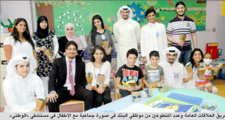
فريق العلاقات العامة وعدد المتطوعين من موظفي البنك في صورة جماعية مع الأطفال في مستشفى «الوطني»

الصاحبة، شارع علي السالم، برج الجوهرة، الدور الثامن، ص.ب. 22816، الصفاة، 12089 الكويت هاتف: 222 44 300 - 224542 (8-24542) +965 1 - فاكس: 22 44 6536 +965 www.ahliaholding.com