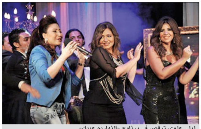
ليلي علوي ترقص في برنامج «النهاريه عبيد»

خلال اللقاء، لكن الجديد هذه المرة ان اينتها شاركتها الرقص أيضا. وقامت المطربة الشعبية هدى بتقديم ثلاث أغنيات خلال الحلقة.