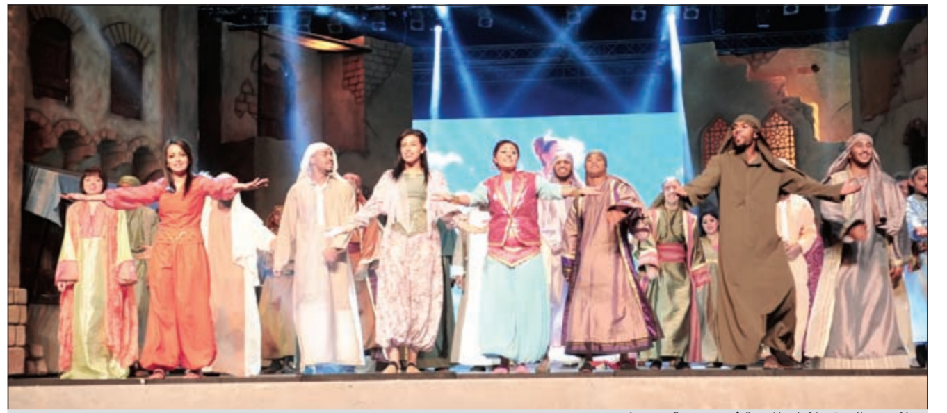
جانب من الاستعراضات المبهره في مسرحية «مصباح زين»

تعرض للجمهور في صالة التزلج فترة عيد الفطر