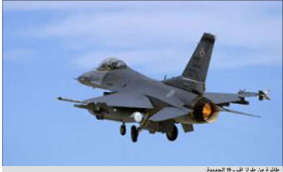
طائرة من طراز أف-16 الجديدة

وبحسب «هارتس» فإن «منطقة العريش تدخل ضمن منطقة الخطر، ومع ذلك قامت مصر بدفع قواتها واستخدام الدبابات والمروحيات المقاتلة في المنطقة المحظورة عليها ووافقت عليها إسرائيل فقط بأثر رجعي». وأشارت إلى ان «إسرائيل قررت عدم الرد على هذا الإجراء الذي جاء من جانب واحد لنقاد الإندلاع مواجهة بين الطرفين».