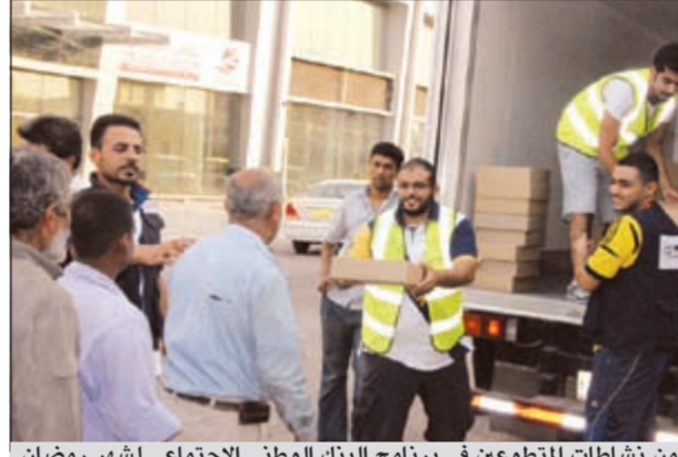
من نشاطات المتطوعين في برنامج البنك الوطني الاجتماعي لشهر رمضان