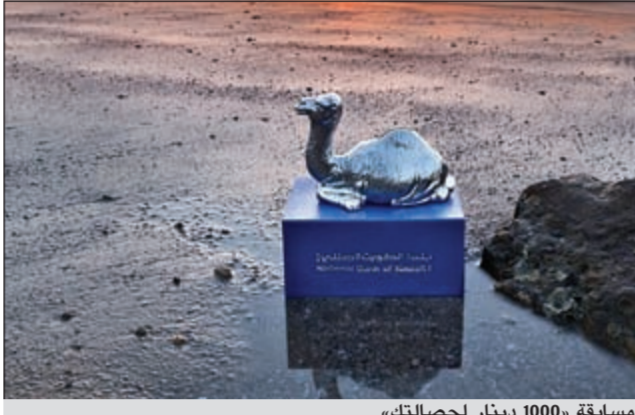
مسابقة «1000 دينار لحصالتك»