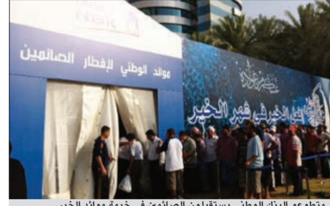
متطوعو البنك الوطني يستقبلون الصائمين في خيمة موائد الخير