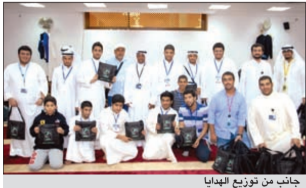
جانب من توزيع الهدايا

ذكرت شركة زين أن شهر رمضان المبارك يمثل لها فرصة كبيرة لتجديد العلاقة الوطيدة بينها وبين عملائها، مبيّنة أن هناك علاقة من نوع خاص خلال هذا الشهر، ليس مع المشتركين فحسب بل لكافة أطراف المجتمع الكويتي. وأوضحت أن هذا التقارب قد أثمر مجموعة كبيرة من المبادرات الاجتماعية والمشاريع الخيرية بالإضافة إلى العديد من المشاركات الاجتماعية، وهو ما تحرص عليه خلال الشهر الفضيل، مشيرة إلى أنها دائما ما تتكف من برامجها الاجتماعية في هذا الشهر الفضيل، وخصوصا في فترة العشر الأواخر، حيث بادرت بتوفير العديد من المستلزمات التي تدعم احتياجات المصلين في عدد كبير من المساجد في مختلف محافظات الكويت. وبيّنت الشركة أنها تهدف من خلال هذه المبادرات إلى توفير سبل الراحة للمصلين الذين تزايد أعدادهم خلال فترة العشر الأواخر من شهر رمضان المبارك، وهي الفترة التي تشهد ازديادا شديدا مع تزايد عدد المصلين الوافدين على مختلف المساجد في الكويت. وأفادت زين بأنها ومن خلال فرق المتطوعين من موظفيها قامت بتوزيع عدد كبير من الهدايا، وهي عبارة عن حقائب تحتوي على مستلزمات مختلفة تساعد المصلين في أحياء العشر