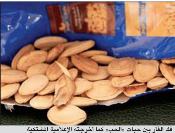
فك الفار بين حبات «الحب» كما أخرجته الإعلامية المشتكية

وكالات: تفاجت اعلامية سعودية بوجود «فك فار» داخل كيس «حب» ورفض أحد فروع الشركة اعطائها تعويضا «لكن مدير التسويق اكد استعداد الشركة لعلاجها اذا ثبت مرضها بسبب هذا المنتج»، معتبرا ان «هناك حربا خفية تقاد ضدنا». وقالت الاعلامية السعودية وفق ما نقلته صحيفة «سبق» السعودية امس: «تفاجت وأنا ادخل يدي في كيس حب بفك فار، حيث امسكت بشيء قاس». وأضافت: «اتصلت على خدمة العملاء وقالوا: اذهبي لاقرب فرع وسلمي العينة وبعد ثلاثة ايام سنتخذ معك اجراء ونتصل بك».