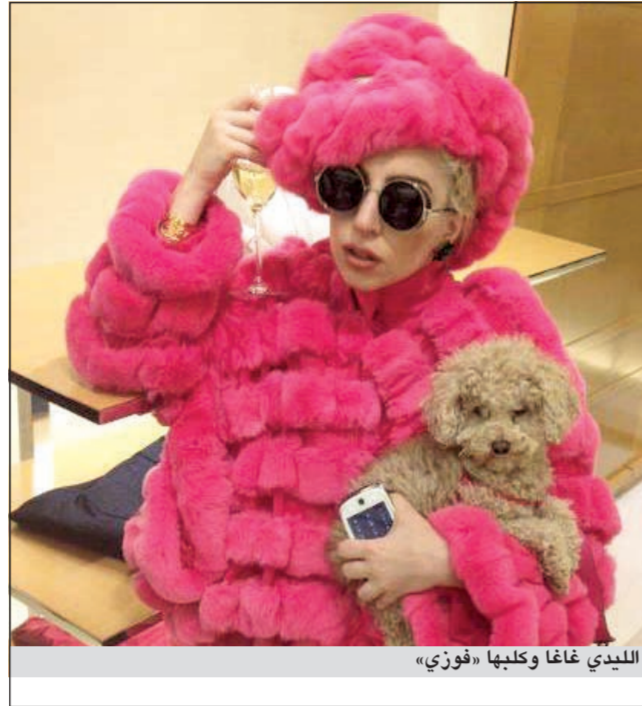
ليدي غاغا وكلبيها «فوزي»

لندن - يوبي.أي: تبدي النجمة الاميركية ليدي غاغا ولعا كبيرا بكلبيها «فوزي» لدرجة انه لا يفارقها حتى في حوض الاستحمام. ونقلت صحيفة «صن» البريطانية عن مصدر مقرب من النجمة الاميركية قوله ان غاغا مهووسة بالكامل بفوزي وهي تعامله كما لو انه طفلها. وأضاف انها «تأخذه معها الى السرير وحتى للاستحمام معها». ولفت المصدر الى ان اهتمام ليدي غاغا بكلبيها لم يقف عند هذا الحد وإنما خصصت له طاهيا يهتم بما ياكله خلال انشغالها بحفلاتها في اوربا. وأضاف ان ليدي غاغا اقامت لكلبيها الاسبوع الماضي حفلا بمناسبة عيد ميلاده واشترت له وعاء من الذهب والماس.