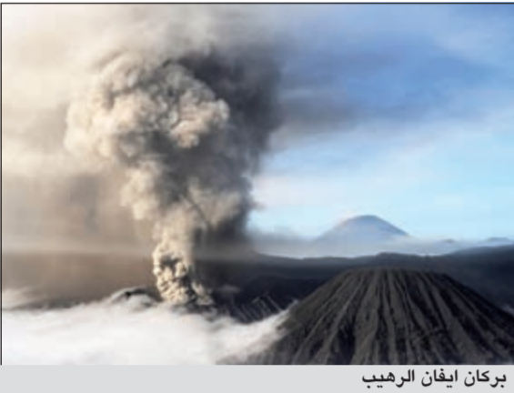
بركان إيفان الرهيب

موسكو - يوبي.أي: ثار بركان «إيفان الرهيب» امس في جزيرة ايتورتوب التي تعد جزءا من مجموعة جزر الكوريل في الشرق الأقصى الروسي، وأفادت وكالة الأنباء الروسية نوفوستي بان بركان إيفان الرهيب قذف رمادا في الاجواء وأشارت الى ان سكان القرى والمدن المجاورة لاحظوا وجود رائحة غاز الكبريت بالهواء. ولم يشكل ثوران البركان اي خطر على السكان بالمناطق المجاورة. وتستمر مراقبة تحركات البركان في وقت يسجل فيه ارتفاع لنسبة انبعاثات الغاز من الجزء الشمالي الشرقي فيه.