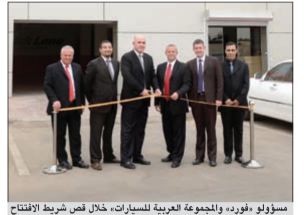
مسؤولو «فورد» و«المجموعة العربية للسيارات» خلال قص شريط الافتتاح

قامت شركة فورد الشرق الأوسط والمجموعة العربية للسيارات، الوكيل المعتمد للسيارات فورد وليتولون في الكويت، مؤخراً بافتتاح أول مركز «كويك بارتس» Quick Parts في منطقة الشويخ، وذلك في إطار الجهود المتواصلة لتوسعة انتشار فورد وتعزيز حضورها مع قطع غير MotorCraft، وفي الوقت ذاته تقديم خيارات جديدة بأسعار مناسبة من قطع الغيار لمختلف السيارات وتوفرها للعملاء في الكويت. ويعتبر مركز «كويك بارتس» مبادرة جديدة من قسم عمليات التنمية والتصدير لدى فورد الشرق الأوسط، وهو مصمم لتحسين خدمة العملاء، من خلال زيادة توفير قطع الغيار. وفي حين إن المتاجر تقدم قطع الغيار التي تحمل علامتي فورد و«موتوركرافت» Motorcraft التجارية، والاكسسوارات والبضائع التي تحمل علامة فورد التجارية، فإن قطع الغيار المصنعة للمنافسة في السوق تكون متوفرة في حال لم تتواجد أي تطبيقات من شركة «موتوركرافت».