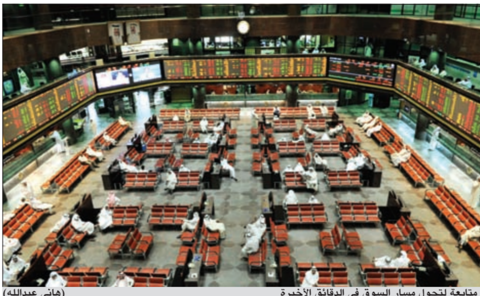
متابعة لتحول مسار السوق في الدقائق الأخيرة (هاني عبدالله)

قطاعات ارتفعت مؤشراتها في جلسة أمس تصدرها قطاع المواد الأساسية بواقع 6,6 نقاط، فيما سجل قطاع التكنولوجيا أعلى تراجع بواقع 6,8 نقاط.