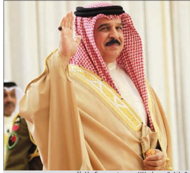
العاهل البحريني الملك حمد بن عيسى آل خليفة

عواصم - وكالات: حذر ملك البحرين حمد بن عيسى آل خليفة في كلمة تلفزيونية بمناسبة العشر المبارك، من شهر رمضان المبارك، من مكر الماكرين ودعاة الفتنة والمغامرين والمقامرين بوحدة الشعب وتماسكه ومكاسبه. وأضاف العاهل البحريني أن شهر رمضان المبارك هو مناسبة لنا جميعا للتفكير فيما يجمع كلمتنا ويوحد صفوفنا خضوعا لقرول الله عز وجل (يا أيها الذين آمنوا اتقوا الله حق تقاته ولا تموتن إلا وأنتم مسلمون واعصموا بحبل الله جميعا ولا تفرقوا).