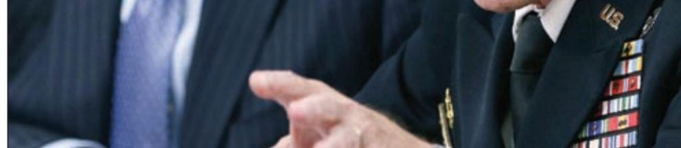
وزير الدفاع الأميركي ليون بانيتا خلال مؤتمر صحفي في البيت الأبيض

في هذا الوقت، رأى وزير الدفاع الإيراني الجنرال احمد وحيدى ان التصريحات الإسرائيلية التي تحدثت عن احتمال مهاجمة المواقع النووية الإيرانية مؤشّر على الضعف والخوف وليست دليلا على القوة.