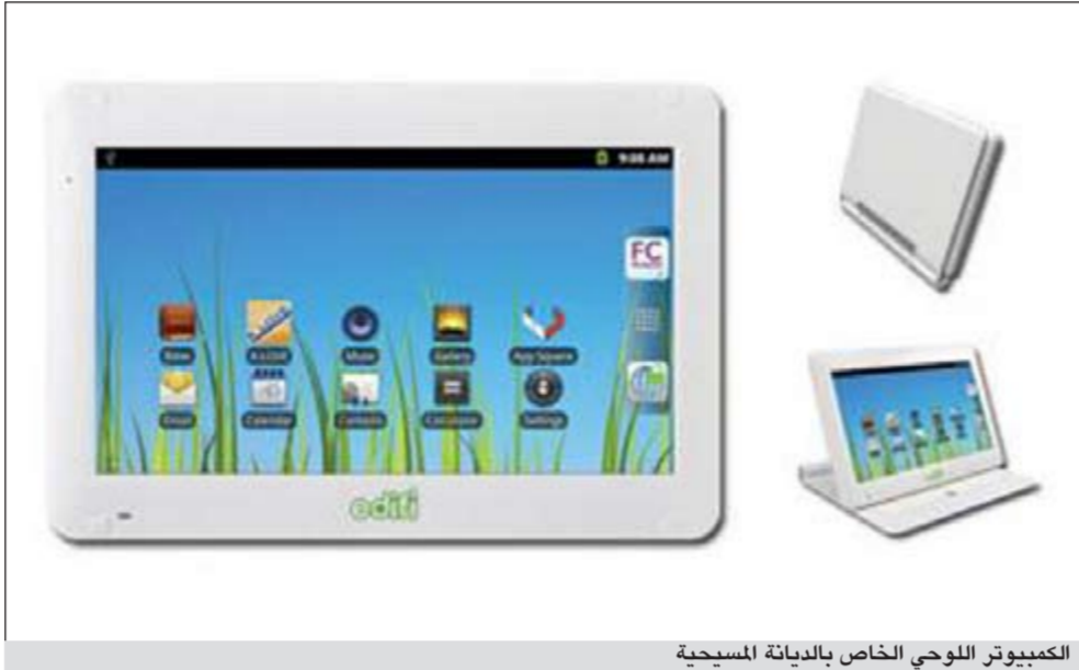
الكمبيوتر اللوحي الخاص بالديانة المسيحية

يلق رواجا كبيرا، وهو ما دفع وزنه عن 500 غرام قليلا، تعود جنوره في عام 2010، حيث كانت شركة Cydle قد قدمته تحت اسم Cydle Multipa M7، ولكنسه لم