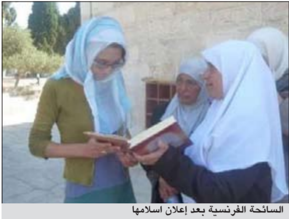
السائحة الفرنسية بعد إعلان إسلامها

غزة - وكالات: أعلنت سائحة فرنسية إسلامها امام طالبات العلم ونطقت بالشهادتين أمامهن وتلست بعض آيات من القرآن الكريم.