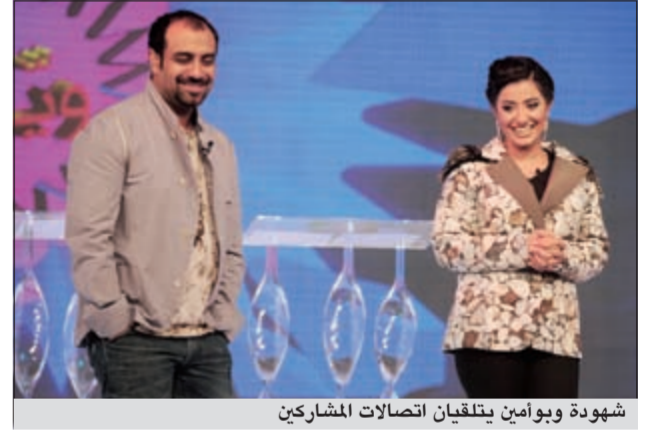
شهودة وبوامين يتلقيان اتصالات المشاركين

ورغم محاولات يومين وشهودة لاستقبال المتصلين المشاهدين قبل نهاية البرنامج، إلا أن الوقت داهمهما وانتهت الحلقة بوعد من عندهما أن غدا «اليوم» سيوزعان هدايا قيمة «كاش» وأجهزة كهربائية وغيرها القيمة من الشركات الراعية للبرنامج وهي «الأبناء»، «كادو فرح»، «زين»، «مختزه خليفة السياحي».