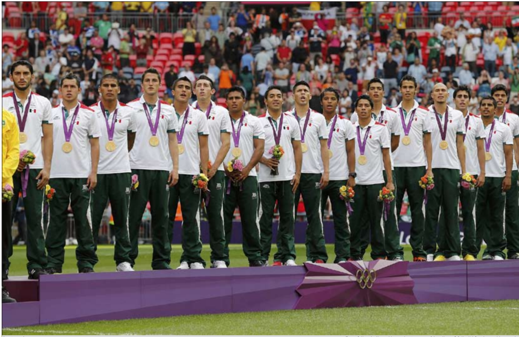
لاعبو المكسيك خلال النشيد الوطني بعد تسلمهم للميداليات الذهبية

الجنوبية لاستلام الميداليات البرونزية بعد استبعاد بارك جونج لأنه رفع لافتة سياسية بعد الفوز على اليابان 2-0 في مباراة تحديد المركز الثالث في كارديف الجمعة الماضي. وكان اللاعب بارك جونج قد عرض رسالته في نهاية مباراة تؤكد على مزاعم بلاده بسيادتها على مجموعة من الجزر المتنازع عليها في بحر اليابان. وأقيمت المباراة بعد ساعات من الزيارة التي قام بها الرئيس الكوري الجنوبي لي ميونج في باك في تسلك الجزر المتنازع عليها.