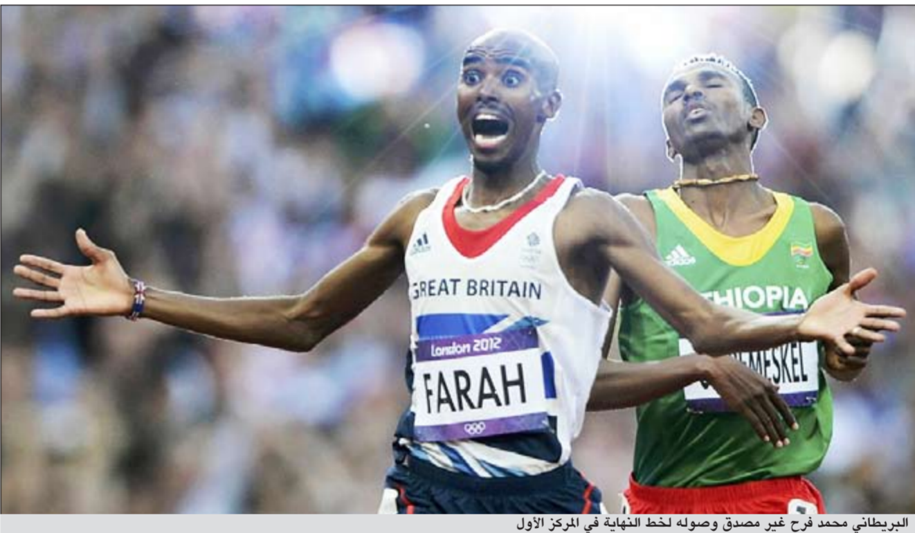
البريطاني محمد فرح غير مصدق وصوله لخط النهاية في المركز الأول

الأخيرة، اما أخصر عدا غير افريقي احرز ذهبية سباق 5 آلاف متر فهو الألماني ديتير باومان في برشلونه 1992. التتابع لسيدات اميركا وأحرزت سيدات اميركا ذهبية سباق التتابع 4 مرات 400 متر ضمن رياضة العاب القوى وحصل ثانيا روسيا بالميدالية الفضية أما البرونزية فذهبت الى جامايكا. كما أحرزت العداة الروسية ماريا سافينوفا ذهبية سباق 800 متر ضمن رياضة العاب القوى وقطعت سافينوفا، بطلة العالم العام الماضي في دايجو، مسافة السباق بزمن 1,56,19 دقيقة وخلفت الكينية ماميليا جيليمو التي فشلت في أن تصبح أول عداة تحتفظ باللقب الأولمبي في سباق 800 متر، حيث حلت رابعة بزمن 1,57,59 دقيقة.