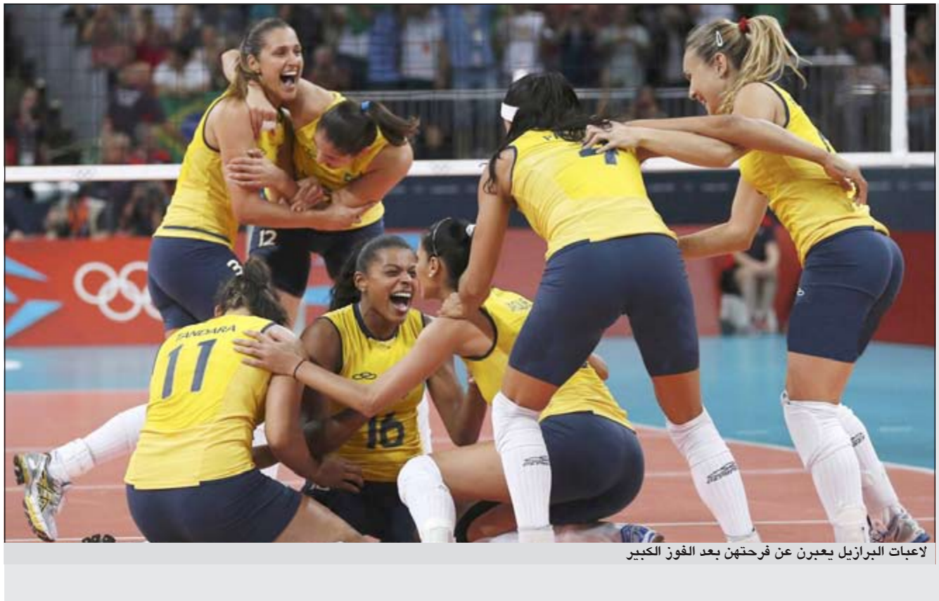
لاعبات البرازيل يعبرن عن فرحتهم بعد الفوز الكبير

وتصدر ايغديدر السباق في اللفة الأولى وسرعان ما انتزعه منه الكيني توماس لونغوسيو، فالبريطاني محمد فرح قبل ان يتبادل للخطات قليلة مع لونغوسيو مجددا، لكن البريطاني تصدر قبل ثلاث لغات من نهاية السباق ونجح بعد مقاومة شرسة من منافسيه في اجتياز خط النهاية. وبسات فرح سادس عدا في التاريخ بحرز الثنائية (5