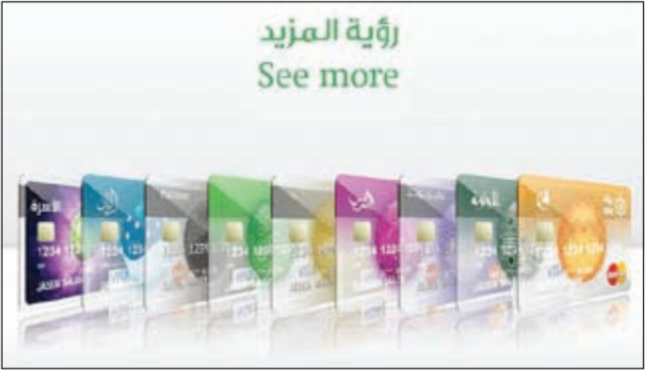
رؤية المزيد See more

المتفاوتة. ويؤكد التجارب المشجع مع حملات «بيتك» التسويقية في مجال البطاقات الائتمانية، نجاحه في تقديم المنتجات والخدمات المتكررة التي تلبي احتياجات وتطلعات العملاء من مختلف الشرائح، كما يكشف هذا التجارب عن الوعي المرتفع للعملاء كما يبدو من حجم استخدام البطاقات في الداخل والخارج. وينعكس هذا النجاح للحملات التسويقية على الأهداف التي يرمي «بيتك» إلى تحقيقها وفي مقدمتها خلق حالة من الرواج في السوق وتنشيط مبيعات التجار، وفي الوقت ذاته تعميم ثقافة استخدام البطاقات بديلاً عن النقود. ويؤكد «بيتك» سعياً الدؤوب لتوفير أفضل الخدمات والعروض لعملائه، بالتعاون مع كبرى الشركات العالمية المصدرة للبطاقات الائتمانية، وبالتنسيق مع التجار والمحلات التجارية ومراكز التسوق داخل الكويت وخارجها.