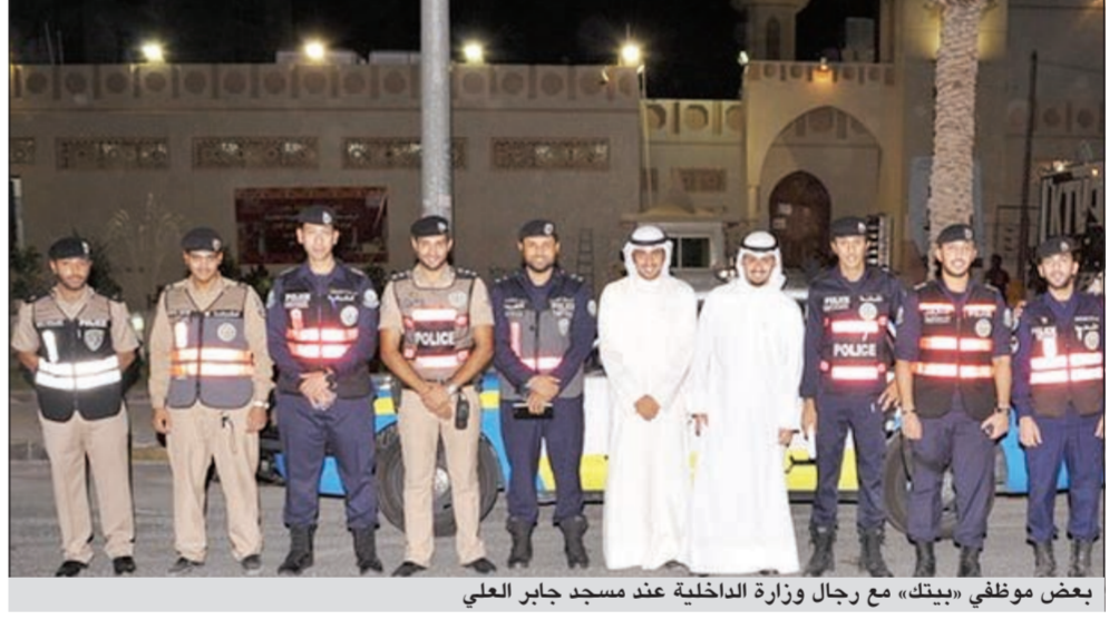
بعض موظفي «بيتك» مع رجال وزارة الداخلية عند مسجد جابر العلي

الدور عن حرصه على مشاركة جمهور العملاء المناسبات المختلفة وخدمتهم، بالتعاون مع الجهات المعنية في كل مناسبة حيث يساهم في التنسيق والترتيب الجيدان في