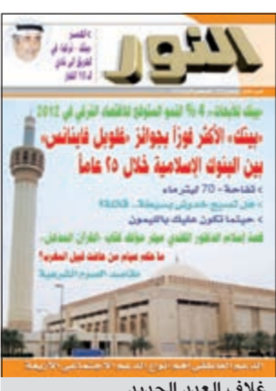
غلاف العدد الجديد

صدر العدد الجديد لشهر أغسطس من مجلة النور التابعة لبيت التمويل الكويتي (بيتك) ویراس تحريرها سعيد توفيق والذي تناول في افتتاحية العدد أسئلة القوائدین وتجربة «بيتك» قبل 33 عاما حيث لم يكن في الكويت أي مصرف يتعامل وفق احكام الشريعة، وكيف استطاع «بيتك» بجهود المخلصين وفي مقدمتهم المغفور له الشيخ احمد بزیع الیاسین ان يتجاوز كل العقبات ليحقق انجازا غير مسبوق على