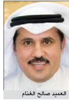
العميد صالح الغنم

أحال وكيل وزارة الداخلية المساعد لشؤون الأمن الجنائي اللواء عبدالحاميد العوضي الى نيابة المخدرات 3 أشخاص من غير محددى الجنسية بتهمة الاتجار في المواد المخدرة وأرقي في ملف القضية ربع كيلو من مادة الحشيش و1000 حبة مخدرة و60 غراما من مادة الشبو وغالبية الثمن، وقال مصدر أمني ان معلومات وردت