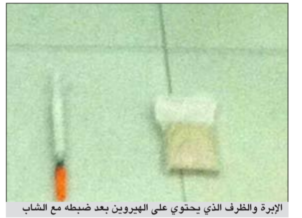
الإبرة والظرف الذي يحتوي على الهيروين بعد ضبطه مع الشاب

احيل مواطن الى الادارة العامة لمكافحة المخدرات بعد ان ضبط في جيبه الامين ابرة «سرنجة» بها مادة بيضاء تبين انها حقنة بها هيروين الى جانب لفاقة بها هيروين ايضا، وقال مصدر امني ان دورية سرية المهام الخاصة التابعة لعمليات الامن العام بقيادة الملازم اول عبدالله العجمي والملازم طلال المهمل اشتبهت في مركبة يترنح قائدها بها، ولدى توقيف قائد المركبة تبين انه في حالة غير طبيعية، وبفتيش السيارة وتفتيشه ذاتيا عثر معه على المضبوطات.