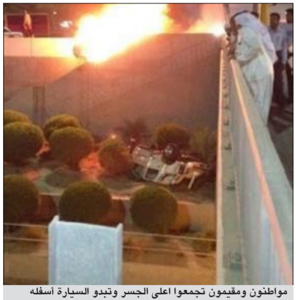
مواطنون ومقيمون تجمعوا اعلى الجسر وتبدو السيارة أسفله

لقي شخصان مصرعهما في حادث تصادم وانقلاب واحترق إحدى المركبتين على طريق المغرب السريع في تقاطعه مع الدائري الأول، وقال مصدر امني ان الحادث المروري المروع وقع بعد افطار يوم الجمعة الماضي مشيراً الى ان رجال المرور عاينوا الحادث لتحديد المسؤول عنه فيما اُحبلت الجثتان للمطب الشرعي، لافتاً الى ان قوة الاصطدام دفعت إحدى المركبتين إلى السقوط من أعلى الجسر.