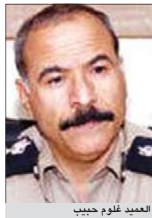
العميد غلوم حبيب

امر مدير أمن محافظة حولي العميد غلوم حبيب بإحالة عسكري يعمل في الحرس الوطني الى نظارة مخفر ميدان حولي، وأودع بداخل النظارة الى جانب مرافقه المتعاطي للحبوب المخدرة. وقال مصدر أمني إن بلاغا تلقته عمليات وزارة الداخلية من داخل صالة الألعاب البلياردو، حيث تضمن البلاغ أن هناك شخصا بزيه العسكري يلعب البلياردو وخلال لعبه كان يحتسي الموالد المسكرة من زجاجة خمر، وأن أشخاصا أبلغوه بخطورة