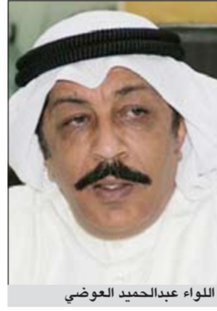
اللواء عبدالحاميد العوضي

واستنادا الى مصدر أمني، فإن جريمة اللصوص الأربعة والتي وقعت داخل منطقة السلام تملك في طرق باب أحد المنازل بعد أن أجروا مراقبة دقيقة عليه، وما ان فتحت وافدتان أسبويتان الباب حتى فوجئتا بأعضاء العصابة يدخلون عنوة ويعتديان بالضرب على الخادمتين، وقام بعض أفراد العصابة بالاعتداء عليهن جسديا وخرجوا بمسروقات تتجاوز الـ 10 آلاف دينار. أما جريمتهم في منطقة مشرف، فتمثلت في دخول الجناسه الى المنزل بالطريقة ذاتها، حيث وضعوا سكاكين وأدوات حادة على رقاب الأطفال، مشيراً الى ان خادمة في