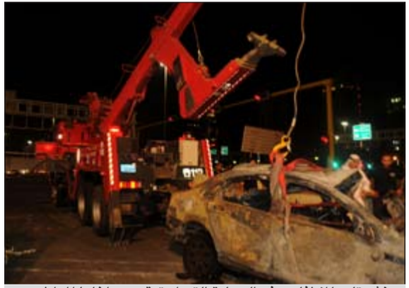
ونش تابع للإطفاء يرفع السيارة التي احترقت وبداخلها المواطن