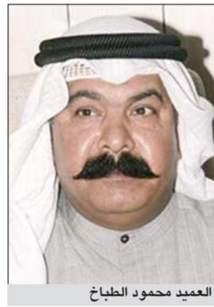
العميد محمود الطباخ

واستنادا الى مصدر أمني فإن مواطنة ترددت على الإدارة العامة للمباحث الجنائية حيث اصرت على لقاء مدير عام الإدارة العامة للمباحث الجنائية العميد محمود الطباخ ولدى لقائهما العميد للصحف قالت انها كانت في طريقها للسفر الى إحدى الدول الأوروبية وخلال ترددها على مكتب صرافة استوقفها وافد لبناني وأبلغها باستعداده لاستبدال العملة