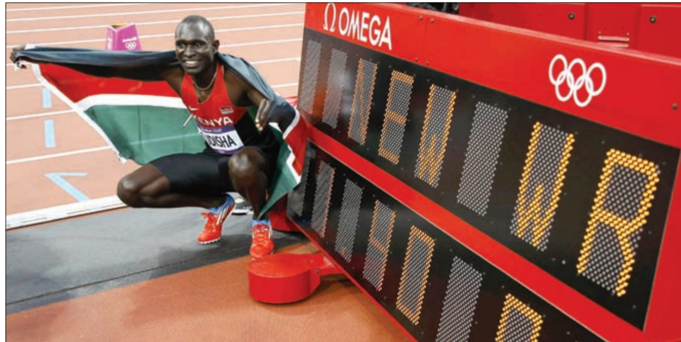
الكنيني روديشا مع رقمه العالمي الجديد

وتقدمت سنغ 3-0 في الجولة الأولى وعززت الفارق في الجولة الثانية إلى 5-0، قبل أن تسعى باولي إلى توجيه ضربات إلى رأس خصمتها لتحرز عدداً أكبر من النقاط، لكنها اكتفت بنقطة. وقالت باولي التي كانت تهدف إلى الميدالية الذهبية، علماً أنها خسرت دوماً مع سنغ في العديد من الأحداث المهمة سنويا وهذا مؤشر