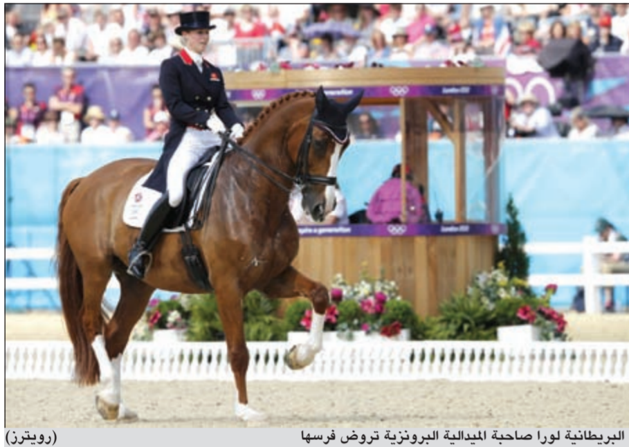
البريطانية لورا صاحبة الميدالية البرونزية تروض فرسها

أحرزت البريطانية تشارلوت دوجاردن الميدالية الذهبية للترويض الفردي في منافسات الفروسية في أولمبياد لندن بعد تفوقها على جميع أقرانها، وسجلت الرياضية البريطانية رقماً أولمبيا جديداً عندما حصلت على 90,089٪، واحتلت الهولندية ادليند كورنليسن المركز الثاني وحصلت على فضية المنافسة برقم أولمبي جديد بلغ 9039 نقطة.