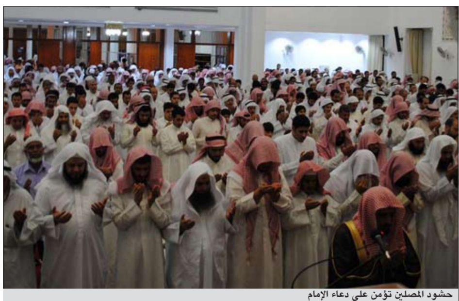
حشود المصلين تؤمن على دعاء الإمام