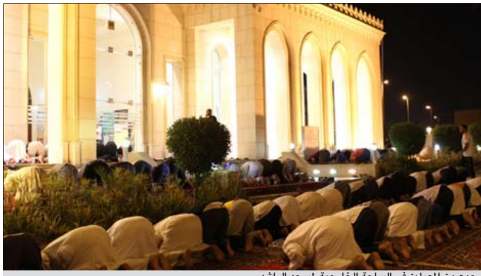
جمع من المصلين في الساحة الخارجية لمسجد الراشد