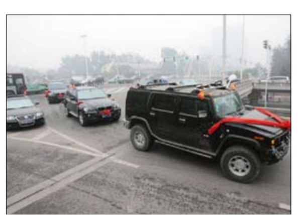
قافلة السيارات الفخمة التي أرسلها الصيني لاستقبال كلبه

وكالات: قام ثري صيني يملك مزرعة كلاب من نوع «ماستيف» في إحدى المدن الواقعة في شمال الصين بانفاق 3 ملايين يين صيني أي ما يعادل 450000 دولار من أجل شراء كلب من الفصيلة السابق ذكرها. وقد قام هذا الشخص بإرسال 20 سيارة فخمة تتضمن أنواع «بورش - مرسيدس - بي ام دبليو - وشاحنات من نوع هامر» تم تزئینها جميعا بوشاح أحمر لنقل الكلب من المطار بالإضافة إلى فرش سجاد أحمر ليسير عليه الكلب! ويقول الثري ان الكلب من دماء صافية ونبيلة وهذا سر المبلغ الضخم الذي دفعه مقابل الكلب وقد جذب الاستقبال الملكي للكلب وسائل الاعلام الصينية لتغطية الحدث.