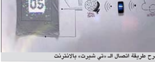
شرح طريقة اتصال الـ«تي شيرت» بالانترنت

وكالات: ابتكر خبراء تقنيون في شركة Cute Circuite البريطانية قميصا قطنيا جديدا يتميز بقدرته خاصة على الدخول على شبكة الانترنت من خلال اتصاله بتطبيق خاص يمكن التحكم فيه بواسطة جوالك الذكي، يتكون القميص من شاشة عرض LED وكاميرا وميكروفون ومكبر صوت ومستشعر حركة، وكلها مدمجة في نسج قطني.